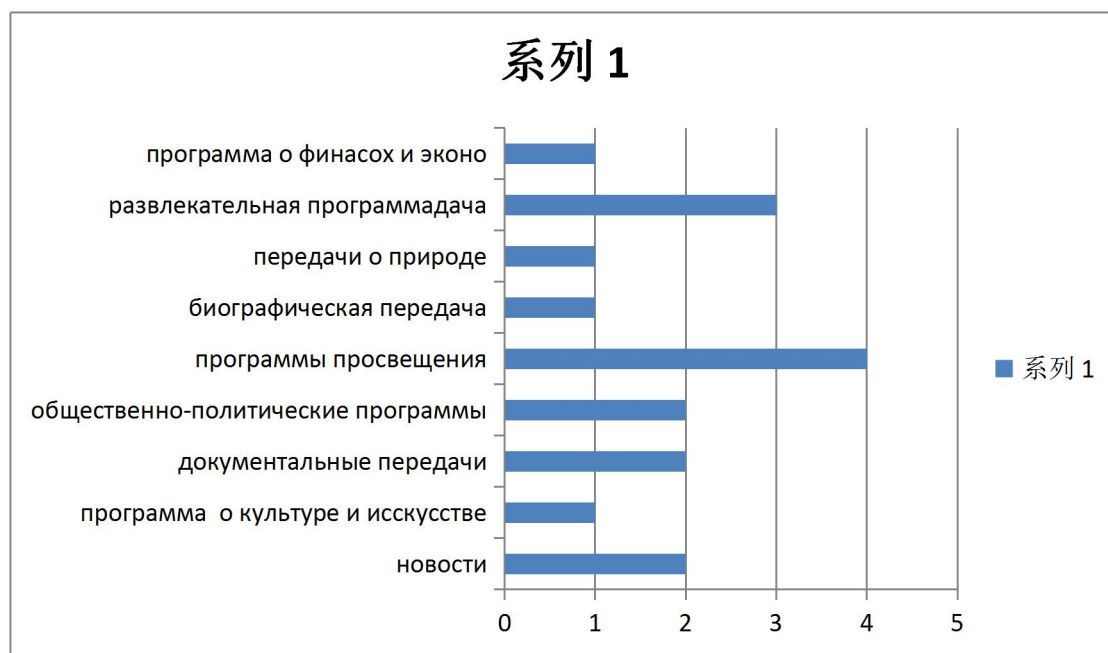
Диаграмма 1. Структура вещания телеканала «ССТV-Русский»

В категории о финансах и экономике выходит программа «Бизнес» - единственный информационный ресурс об экономике на канала ССТV-Русский. «Бизнес» быстро, точно и объективно передаёт последние финансовые новости из Китая и заграницы.