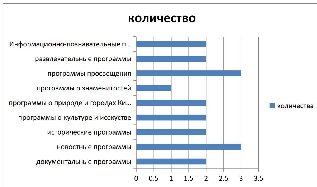
Диаграмма 2. Жанрово-тематическое разнообразие программ телеканала «ССТV-4»

К числу развлекательных программ относится музыкальная программа «Мое китайское сердце / Our chinese heart», где музыка сочетается с личным опытом в жизни и представляет аудитории уникальную китайскую историю, и программа «Спорт».