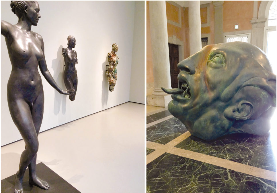
Рис. 3. Гермафродит. 2009. Бронза. Д. Хёрст. Из проекта «Сокровища затонувшего корабля “Невероятный”»; Голова демона, найденная в 1932 г. 2015. Бронза.