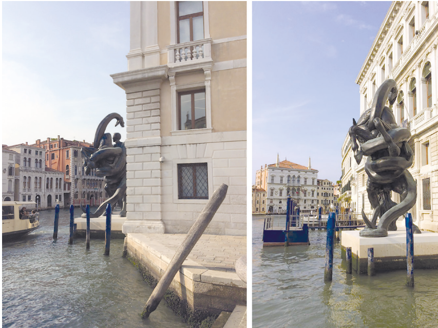
Рис. 1. Судьба изгнанника (Вскармливание). 2014. Бронза. Д. Хёрст. Из проекта «Сокровища затонувшего корабля “Невероятный”».