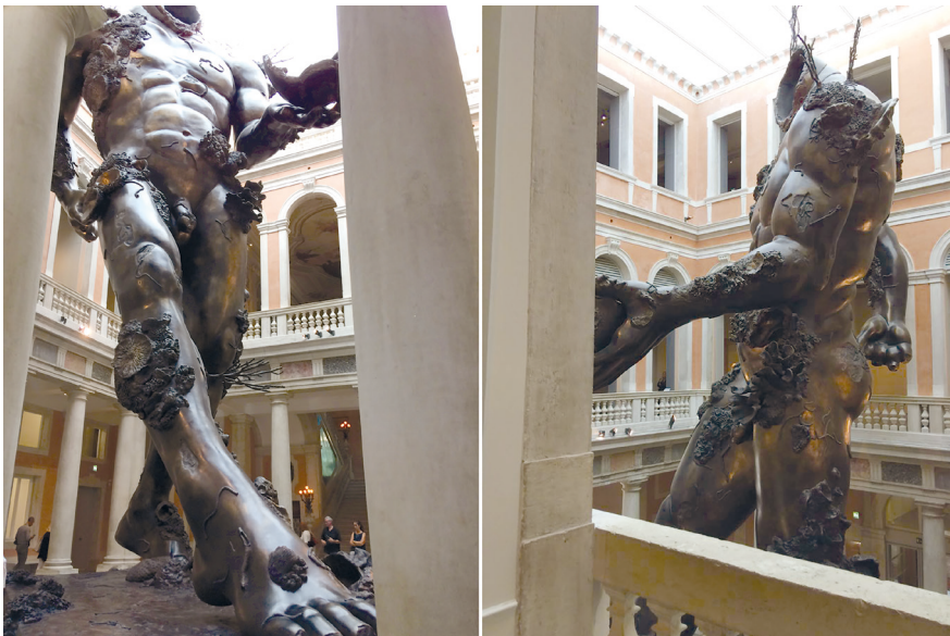
Рис. 2. Демон с чашей. 2014. Полимерная смола. Д. Хёрст. Из проекта «Сокровища затонувшего корабля “Невероятный”».