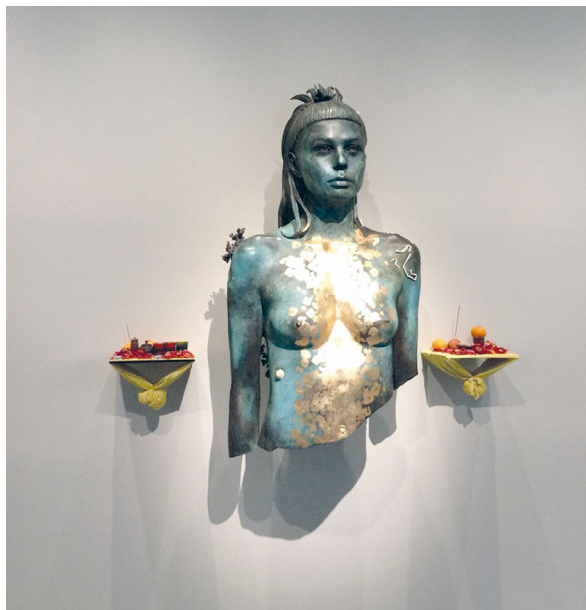
Рис. 7. Кати Иштар Йо-ланди. 2016. Алюминий, полиэстер. Д. Хёрст. Из проекта «Сокровища затонувшего корабля “Невероятный”».

суа Одерматт из Монреаля. Последний так объяснял свой выбор: «Вы видите это, и вы говорите “Вау”. Я хочу владеть искусством, о котором люди могут так сказать — “Вау”» [4].