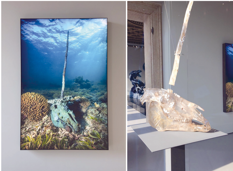
Рис. 5. Череп единорога. 2010. Каррарский мрамор. Д. Хёрст. Из проекта «Сокровища затонувшего корабля “Невероятный”».