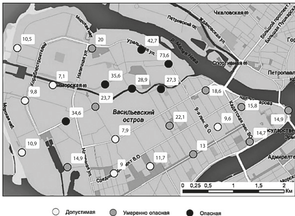
Рис. 3. Карта категорий опасности загрязнения почвогрунтов с учётом погрешности пробоотбора

Исходя из принципа «минимизации возможных вредных последствий» химического загрязнения почв, мы внесли коррективы в нормативные границы категорий опасности в сторону уменьшения их значений. Суть новых границ состоит в том, чтобы измеряемый параметр (в данном случае Z_c ) с учётом установленной нами экспериментально погрешности пробоотбора по методу «конверта» с доверительной вероятностью 95% не смог бы превзойти установленные нормативными значения. В табл. 2. показаны нормативные и рассчитанные нами границы интервалов, определяющих категорию опасности химического загрязнения почв по Z_c .