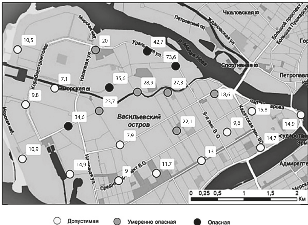
Рис. 2. Карта категорий опасности загрязнения почвогрунтов.

Здесь и на рис. 3 и 5: у точек отбора проб показаны значения показателя Zc