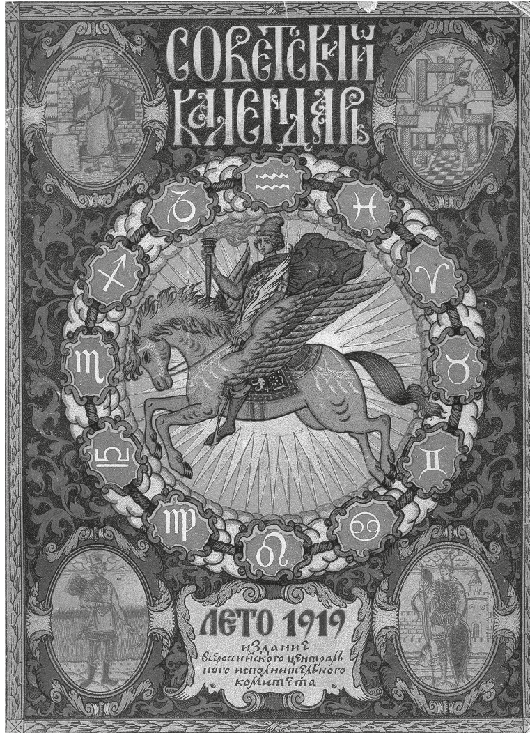
Титульный лист первого советского календаря (Советский календарь на 1919 год. М.: Издательство ВЦИК, 1918)

страницах советских отрывных календарей, а именно: выход первой русской книги (Апостол), казнь Стеньки Разина, Невская битва, Куликовская битва и др. 20