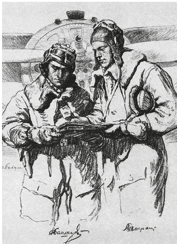
А. Башкиров и А. Севастьянов (справа). Автолитография Н. Пильщикова по рисунку, исполненному до 10 ноября 1941 г. (10 ноября младший лейтенант Башкиров погиб). 1942 г.

в ночь с 4 на 5 ноября он уничтожил в воздушном бою над Ленинградом еще один самолет противника. 5 ноября в приказе по полку сообщалось, что Севастьянов, «израсходовав боекомплект патронов и снарядов РС» (т. е. 4 реактивных снаряда), на высоте 5000 м решил тараном сбить вражеский бомбардировщик Ю-88 20 .