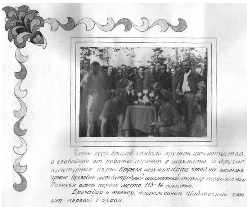
Рис. 1. Альбом польских интернированных лиц, Шахматный кружок. Лагерь № 64 (1947 г.)