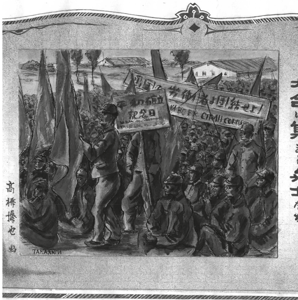
Рис. 5. Альбом японских военнопленных лагеря № 188 (1947 г.)