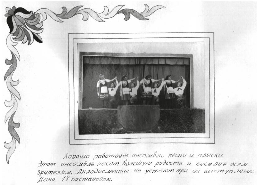
Рис. 3. Альбом польских интернированных лиц. Польский ансамбль песни и пляски. Лагерь № 64 (1947 г.)