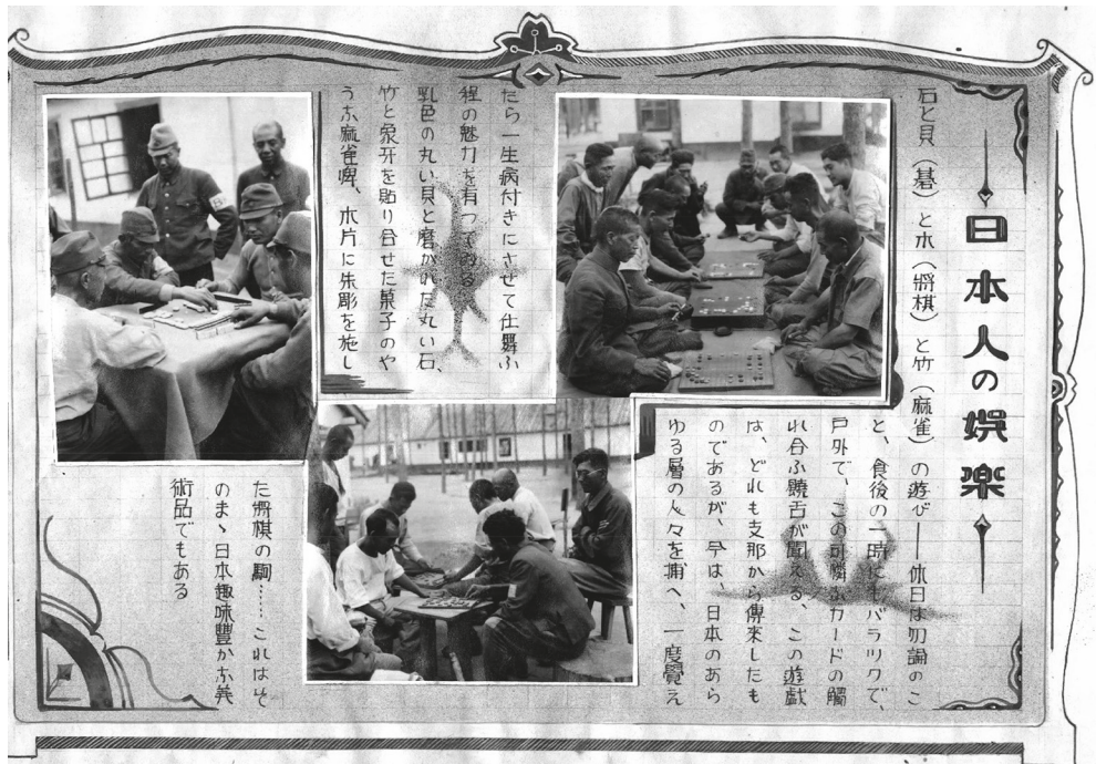
Рис. 4. Обложка альбома японских военнопленных лагеря № 188 (1947 г.)