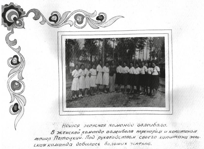
Рис. 2. Альбом польских интернированных лиц, Польская команда по волейболу. Лагерь № 64 (1947 г.)