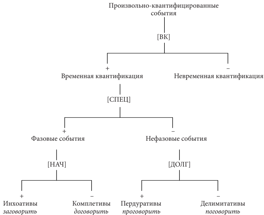
Схема 1. Субкатегоризация произвольно-квантифицированных событий с временной квантификацией

С о к р а щ е н и я : ВК — временная квантификация, СПЕЦ — спецификация, НАЧ — начало, ДОЛГ — долговременность.