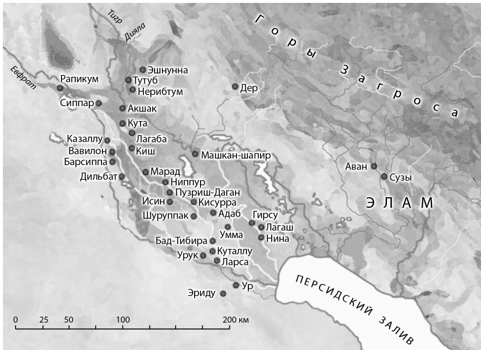
Карта 2. Южная Месопотамия в начале II тыс. до н. э. Основные топонимы, упоминаемые в тексте

Объединение такой большой территории в единую политическую и хозяйственную структуру происходило, очевидно, постепенно и достаточно мирно. В какой-то степени оно стало продолжением на новом историческом этапе тех процессов культурно-хозяйственной унификации, которые были характерны для Южной Месопотамии еще в V тыс. до н. э., а в конце IV тыс. до н. э. привели к возникновению здесь союза городов.