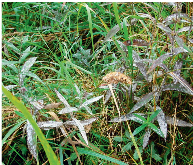
Рис. 2. Поражение Lythrum salicaria мучнисто-росяным грибом Erysiphe lythri

Подводя итог проведенной работы, можно сделать заключение, что данное исследование представляет собой начальный этап изучения микобиоты заказника. Полученные предварительные результаты показали, что видовой состав выявленных на данный момент микромицетов в целом типичен для Ленинградской обл. Наиболее интересные находки сделаны при обследовании редких растений ( Myrica gale ) и растений, обитающих на песчаных пляжах. Разнообразие видового состава, наличие интересных видов, обнаруженных на редких и обитающих в необычных условиях растениях, говорит о необходимости продолжения работы с целью выявления новых для заказника видов грибов, в том числе и в результате расширения территории обследования.