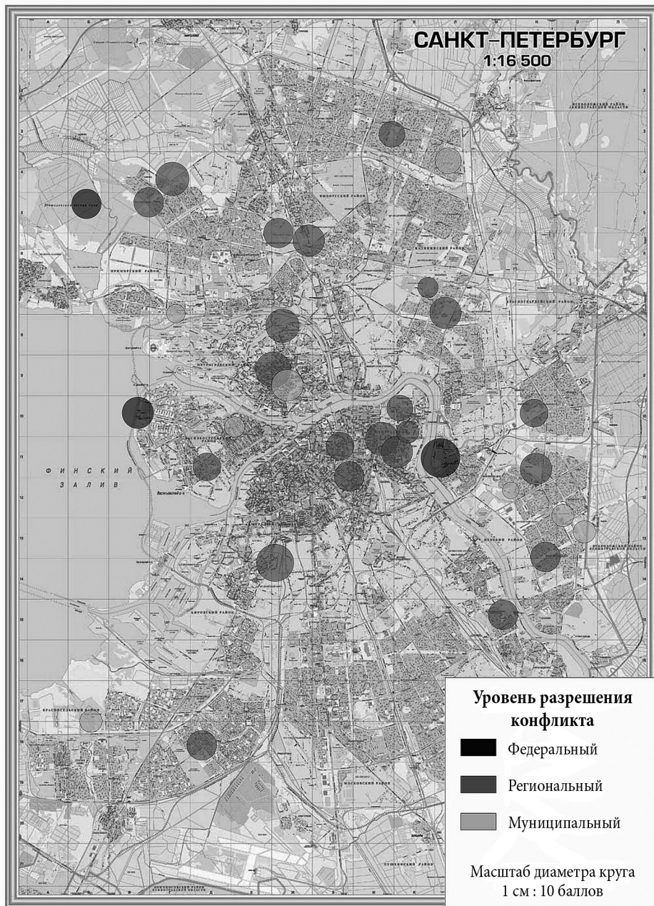
Рис. 3. Пространственно-временные модели влияния экологического и экокультурного протеста на использование городского пространства в Санкт-Петербурге в период 2006–2014 гг.