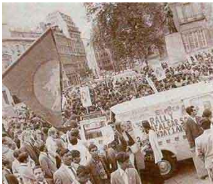
Рис. 5. Мирная демонстрация против расовой дискриминации в Лондоне (1978 г.). 105