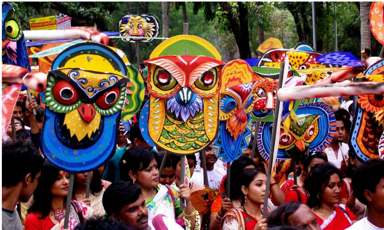
Рис. 6. Празднование Бенгальского Нового года в Лондоне. 106