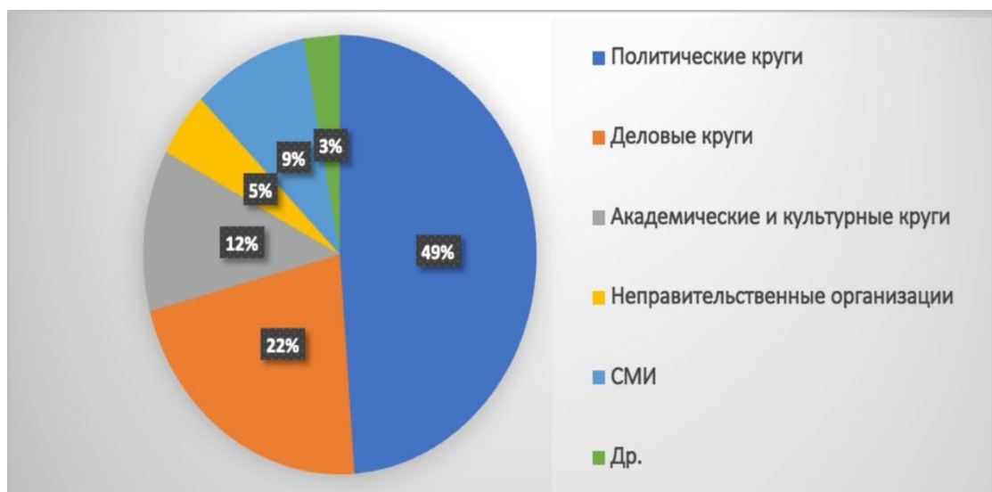
Рисунок 1.4 Обзор общего распределения типов источников информации в освещении по «Севморпути»