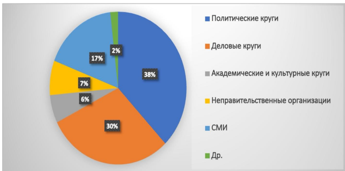
Рисунок 1.2 Обзор общего распределения типов источников информации в освещении по проекту «Ямал СПГ»

Из рисунка 1.2 видно, что основные источники информации Синьхуа сосредоточены в политической сфере, особенно выделяются высказывания правительственных чиновников и важных совещаний, например, во время визита премьер-министра России в Китай 20 декабря 2023 г., где Синьхуа широко цитировала высказывания обеих сторон и содержание послесовещательных коммюнике 71 . Кроме того, часто цитируются мнения представителей бизнеса, что отражает намерение Синьхуа передать поддержку китайского правительства проекту Ямал и продемонстрировать тесное экономическое сотрудничество и согласованную позицию Китая и России.