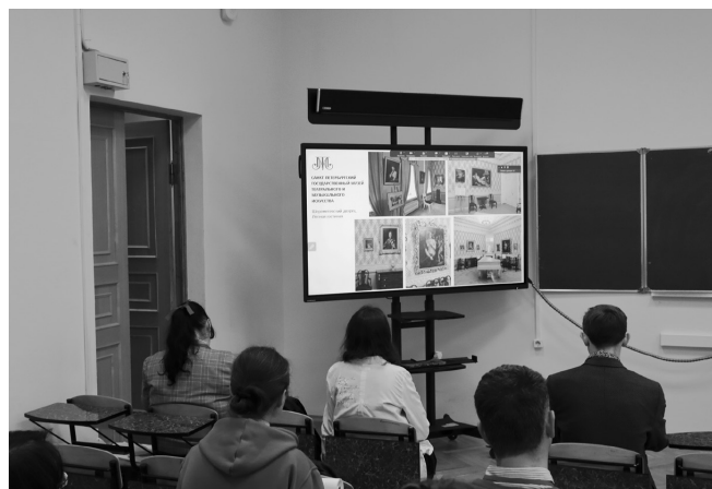
На секции «Работа с визуальными источниками в музеях и архивах», 14 октября 2023

ники обратились к истории и вопросам современной организации архивной отрасли. Внимание было уделено проблемам подготовки современных специалистов в области архивного дела и делопроизводства (круглый стол «Преподавание архивного дела в системе современного образования»), актуальным вопросам архивного законодательства, проблемам использования архивных документов, особенностям работы архивов в цифровую эпоху и возможностям применения в архивах технологий