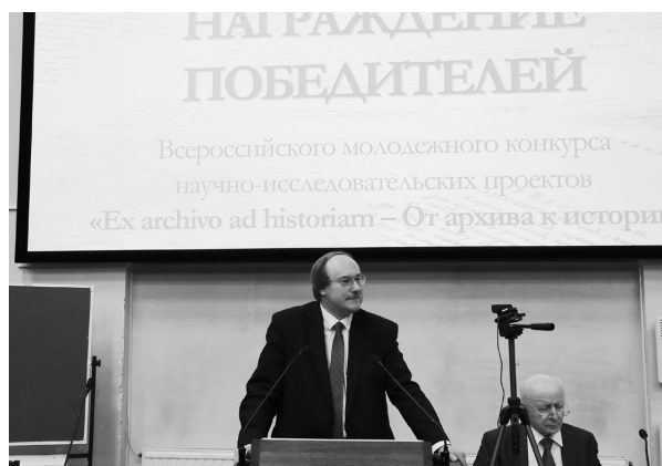
Церемония награждения конкурса «Ex archivio ad historiam — От архива к истории», 10 октября 2023

Особое внимание организаторы уделяют начинающим историкам. В рамках прелиминарных мероприятий был проведен Всероссийский молодежный конкурс научно-