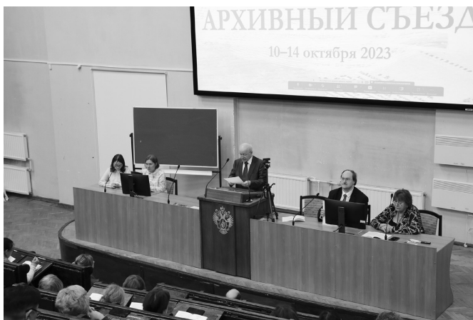
Открытие Третьего Архивного съезда, 10 октября 2023

Историческая тематика, связанная с решением с помощью документов исследовательских задач, изучением архивных материалов, введением в научный оборот и публикацией новых источников, дополнилась вопросами, которые постоянно обсуждают профессиональные архивисты, специалисты в области создания, хранения и использования документального наследия. В современном информационном обществе архивы становятся не только хранилищами национальной памяти, но и инструментом сохранения традиционных духовно-нравственных ценностей. Сегодня появляются новые поводы для обращения к истории отечественного архивного дела, дискуссий и поиска инновационных подходов в решении вопросов, связанных с работой