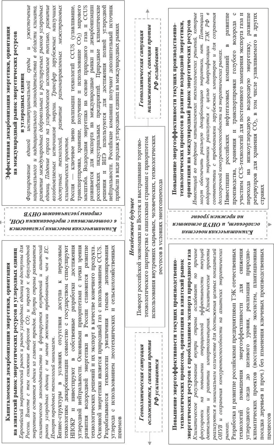
Рис. 2. Стратегии декарбонизации российского ТЭК.

Альтернативные сценарии изменения геополитической ситуации и задач климатической повестки на период до 2030 г.