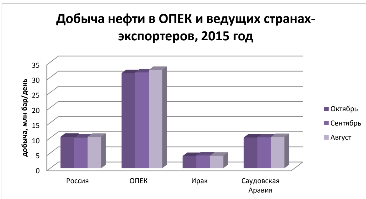
Табл. 3.3. Добыча нефти в ведущих странах экспортерах

Но сейчас даже сам ОПЕК нарушает договоры на квоты и цены. Даже такие страны как Иран, Ирак, Алжир и Венесуэла считают, что надо вносить изменения, для улучшения ситуации на рынке, так как они сами несут потери. Иран указывает, что система совокупных квот, не способна стабилизировать рынок, так как не учитывает индивидуальные квоты стран-участниц. На данный момент ОПЕК добывает около 31,5 млн баррелей в сутки при максимальном ограничении на квоты в 30 млн бар в год. И многие страны заявляют, что не собираются уменьшать объемы добычи, а наоборот будут увеличивать. (Табл.3.3.)