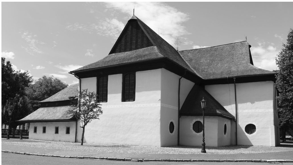
Рис. 2. Кежмарок (Прешовский край, Словакия). Артикулярный костел (1687, 1717–1730).