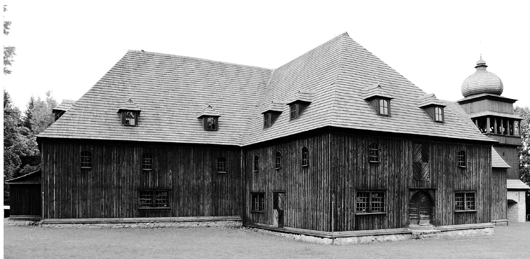
Рис. 7. Свети Криж (Жилинский край, Словакия). Артикулярный костел (1688; 1774).

Ровно через сто лет после Шопронского сейма, в 1781 г. Эдикт терпимости императора Иосифа II еще больше расширил права представителей основных христианских