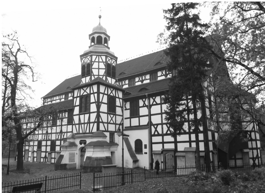
Рис. 1. Явор (Нижнесилезское воеводство, Польша). «Костел мира» (1654–1655).

внимание протестантским костелам уделил Д. Бакстон 2 . После событий «Бархатной революции» исследование архитектуры на территории стран Восточной Европы ожидало получило новый мощный импульс 3 . В 2010-е гг. существенный вклад в анализ протестантских костелов Словакии был сделан М. Дудашем. Он обратил внимание на накопившийся в историографии груз не вполне достоверных интерпретаций самого