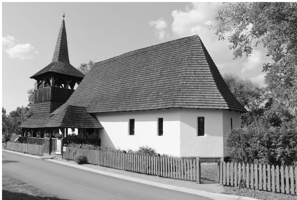
Рис. 4. Такош (Сабольч-Сатмар-Берег, Венгрия). Кальвинистская церковь (1766; 1784).

ский проповеднический пафос нуждался в дополнительных средствах визуализации. Крестообразная композиция была не единственным дифференцирующим признаком. Сама строительная технология каркасных деревянных храмов-«ковчегов» использовала иной «язык», демонстративно выделяющий протестантские костелы из массы католических и униатских деревянных церквей, сложенных из горизонтальных брусьев. Отказ от срубных построек, искони свойственных славянской народной архитектуре, ознаменовал обращение к привнесенной германской (североевропейской) практике и свидетельствовал о принципиальном размежевании в вопросах не только вероисповедания, но и в самой принадлежности прежней культурной традиции. Иные строительные технологии могут быть также следствием тесных связей со странами Северной Европы и значительным количеством образцов церковного зодчества, которые представители восточноевропейских протестантских общин могли видеть во время сбора средств в различных приходах 7 .