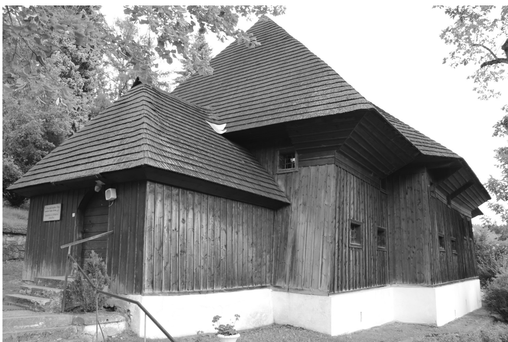
Рис. 3. Истебне (Жилинский край, Словакия). Артикулярный костел (1686; 1731).