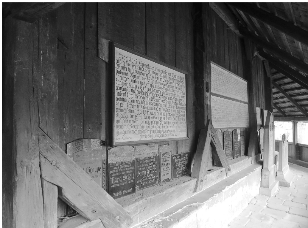
Рис. 5. Броумов (Краловеградский край, Чехия). Костел Богоматери (ок. 1450). Галерея.

мачтовых каркасных церквях, которые он рассматривает в самом широком контексте европейского деревянного зодчества. Перечисляя памятники в Прусской Силезии, Австрийской Силезии, Галиции, Моравии, Богемии и Венгрии, Л. Дитрихсон приходит к выводу, что «церкви срубной конструкции, то есть сложенные из горизонтальных балок в угол, столь же типичны для славянских земель, как каркасные храмы — для Западной Европы» 8 . В случае, когда на славянских территориях появляется деревянная постройка «иноязычного» (германского) характера, исследователь находит этому вполне логичное объяснение. Описывая католический костел в чешском Броумове (Рис. 5), представляющий собой своеобразный и неожиданный вариант «деревянного фахверка», Л. Дитрихсон подчеркивает, что эта постройка «в своем настоящем виде явно относится к более позднему периоду чешской истории, отмеченному господствующим положением немецкой культуры. <...> Столбы и поперечины фахверковой конструкции всюду для устойчивости скреплены подкосами (диагональными брусками). <...> Другая важная деталь, хотя ее и невозможно передать на рисунке: вертикально расположенные доски прибиты к внутренней стороне балок гвоздями, а не вложены в пазы. Рассмотренный