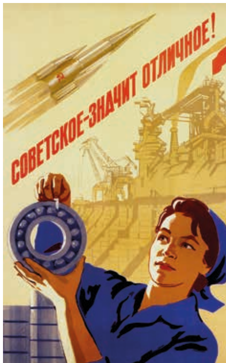
А. Н. Добров. Советское — значит отличное! Плакат. 1961

Наконец, заметная часть пропагандистской продукции погружала космическую тему в международный контекст. Выше уже приводились примеры, как на языке образов советский космонавт становился выразителем идеи интернациональной солидарности. Кроме того, достижения страны позиционировались в качестве вклада в дело мира и прогресса всего человечества. Холодная война давала повод еще и для острой сатиры на идеологического противника, который эпизодически присутствуя в плакатах о космосе 33 , гораздо полнее раскрылся в карикатурах газет и журналов. После советского прорыва высмеивались посрамленные заокеанские деятели, твердившие о технологической «отсталости русских» и пополнившие ряды «просчитавшихся “пророков”» 34 , — именно так, в свете празднования 40-летия Великого Октября, Б. Ефимов представил всех, кто на различных витках истории сомневался в возможностях Страны Советов. Также карикатуристы иронизировали насчет запусков, разрекламированных, но проваленных американцами, обличали их попытки дискредитировать СССР. Например, данное «Голосу Америки» задание «облаять» 35 аппарат «Спутник-2», запущенный 3 ноября 1957 г. с собакой Лайкой на борту. В начале 1960-х гг. акцент сместился на проблему милитаризации космического