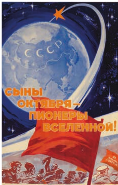
Е. П. Соловьев. Сыны Октября — пионеры Вселенной! Плакат. 1961

Второй знаковый контекст, отчетливо прослеживающийся в агитационных материалах, связан с практикой конструирования национального (гражданского) самосознания . Так, на фоне визуальных отсылок к космическим успехам активно создавался коллективный портрет советских людей, прославлялось их мужество, труд, разум и творческий гений. Плакатным текстам здесь были свойственны обобщения, подразумевавшие особый тип идентичности: «Освобожденный и созидательный труд людей нового социалистического общества...» (худ. Е. Соловьев, 1958), «Мы дива-дивные творим» (худ. В. Корецкий,