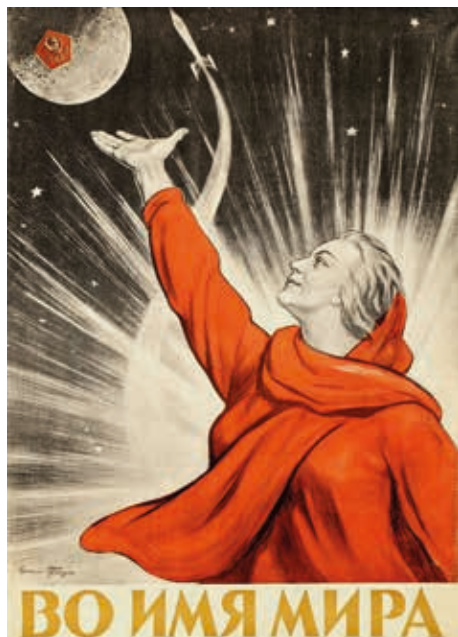
И. М. Тоидзе. Во имя мира. Плакат. 1959

Страну Советов точно так же, как, например, кубинка в оливковом берете олицетворяла тогда остров Свободы 29 . Следует отметить, в наглядной агитации на тему космоса небывалое и прорывное тесно переплеталось с тем, что входило в ментальный код советских людей еще с поэзией Маяковского, маршами и песнями 1920–1930-х гг.: «Радуюсь я — это мой труд вливается в труд моей республики»; «Мы рождены, чтоб сказку сделать былью!»; «Я другой такой страны не знаю, где так вольно дышит человек!» — эти знакомые не одному поколению граждан строки на рубеже 1950–1960-х гг. легли в основу работ плакатистов Л. Голованова, В. Викторова, М. Маризе и др. А художник И. Тоидзе перенес в наступившую космическую эру главную героиню своего знаменитого плаката первых дней войны, хотя теперь патетика образа «Родины-матери» осмыслена уже не в мобилизационном и тревожно-суровом, а в мирном и торжественно-праздничном ключе 30 .