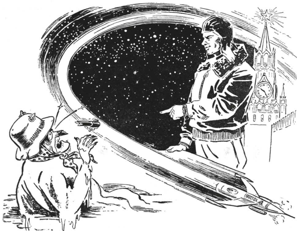
Юрий Алексеевич ГАГАРИН: — Вот тебе, «бабушка», и Юрьев день...