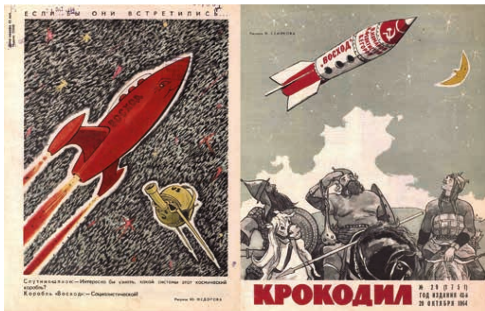
Крокодил. 1964. № 29. Обложка