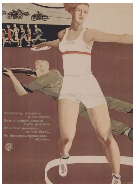
Рисунок 3. «Физкультурница», А. Дейнека, 1933 год