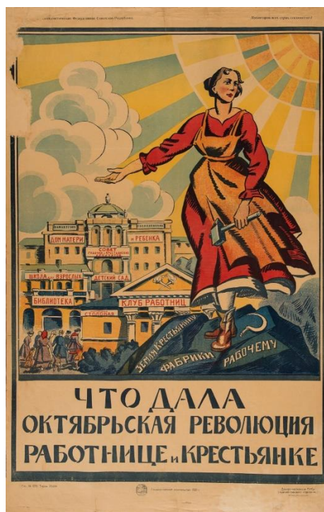
Рисунок 2. «Что дала Октябрьская революция работнице и крестьянке», 1920 г.

Наиболее иллюстративным является названный выше плакат «Что дала Октябрьская революция работнице и крестьянке» неизвестного художника (Рис. 2). Героиня изображена с молотом в левой руке. Правой рукой она указывает на государственные институты, способствующие вовлечению женщин в общественно-политическую жизнь, повышению грамотности и освобождению от работы по дому и материнству. Героическое в образе «новой женщины» подчеркивается с помощью красной одежды, молота как символа «нового советского общества», серьезного выражения лица без улыбки, а также лучами солнца, на фоне которых изображена героиня.