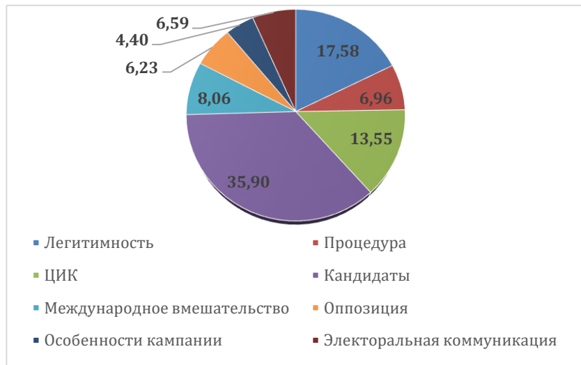
Рисунок 1 - Результаты контент-анализа. «Российская газета»