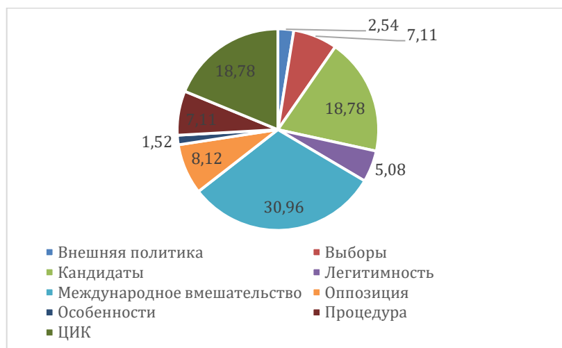
Рисунок 2 - «Изнестия». Результаты контент-анализа

Во-вторых, тональность медиасообщений отличалась: в «Российской газете» наблюдалась преимущественно положительная тональность – 61,54% (см. Приложение Б, рис.2), а в «Изнестия» негативная тональность практически сравнялась с положительной - 39, 09% (негативная) и 44,67% (положительная) (см. Приложение В, рис.4). Указанные результаты тональности коммуникативных актов детерминированы «дозированием» определенных тем, например, для «Российской газеты» это преимущественно промежуточные результаты организации избирательного процесса, гарантии качества и соблюдения установленных избирательным правом требований, заключающих положительную коннотацию текстов. В «Изнестиях» противоречивость политических реалий экстраполируется на политический агональный дискурс, в котором градация конфликтности колеблется от тактики дистанцирования до демонстрации серьезных угроз для внутривполитических процессов государства.