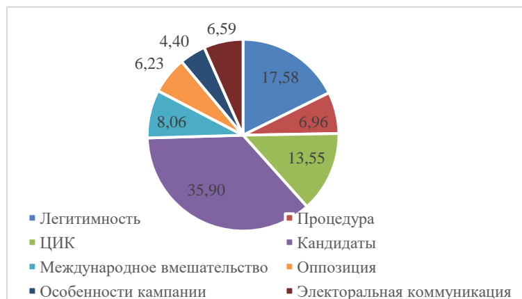
Рисунок 1 - «Российская газета». Результаты контент – анализа

Исследуя политический дискурс федеральных СМИ на материалах двух источников, можно выделить следующие особенности, сопоставив их друг с другом (См. Приложение Б, рис. 1, рис. 2 и Приложение В, рис.3, рис. 4). Во-первых, на основании проведенного количественного контент-анализа главные категории дискурса варьируются в зависимости от источника («Российская газета» - «кандидаты» - 35,8%; «Известия» - «международное вмешательство» - 30,9%). Следовательно, можно констатировать, что повестка дня незначительно, но отличалась.