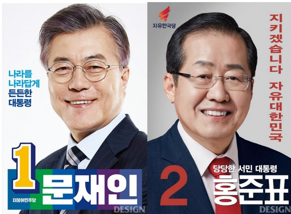
Кандидат Мун Чжэин