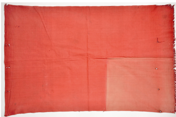
Рис. 3. Флаг, водруженный советскими войсками при освобождении г. Брянска. Из коллекции ВИМАИВиВС. Фото И. А. Садовой