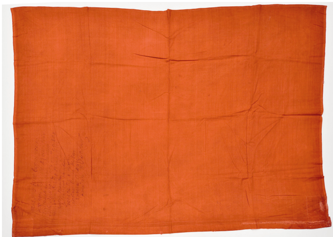
Рис. 10. Флаг, водруженный на самое высокое здание, при освобождении советскими войсками г. Таллина.