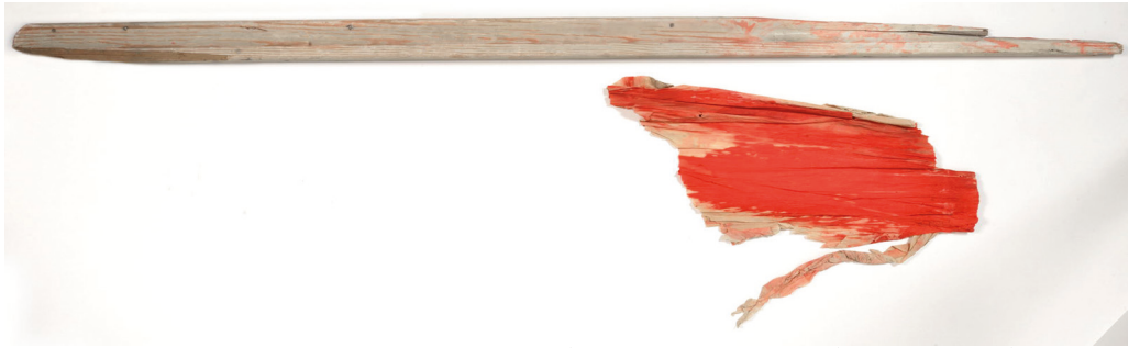
Рис. 6. Фрагмент полотнища и древко. Флаг был водружен при освобождении г. Выборга. Из коллекции ВИМАИВиВС.