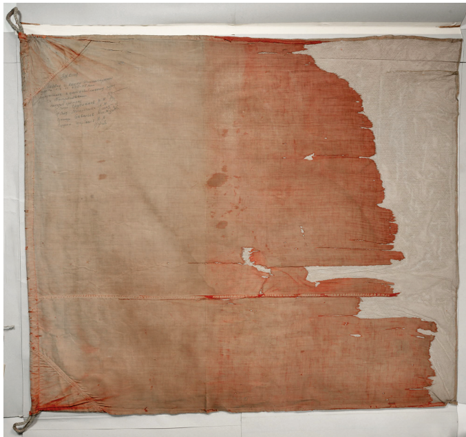
Рис. 8. Флаг, водруженный советскими войсками при освобождении г. Шлиссельбурга. Из коллекции ВИМАИВиВС. Фото И. А. Садовой

лана на их полотнищах. Примером этому могут служить флаги, водруженные при освобождении Шлиссельбурга и городов Эстонии: Нарвы и Таллина.