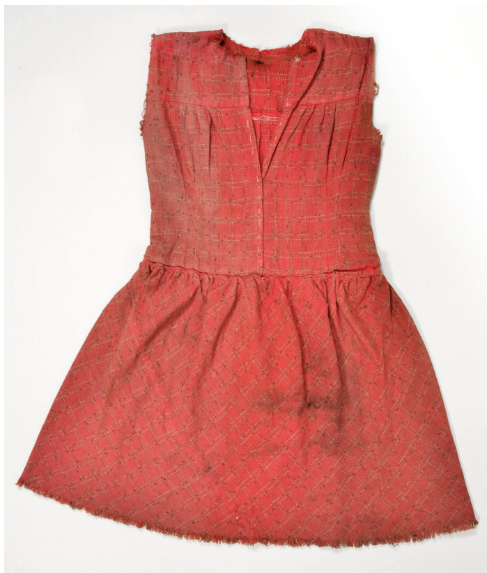
Рис. 4. Флаг из детского платья, водруженный советскими войсками при освобождении г. Выборга. Из коллекции ВИМАИВиВС. Фото И. А. Садовой