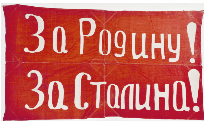
Рис. 2. Флаг, водруженный советским войсками при освобождении г. Орла. Из коллекции ВИМАИВиВС. Фото И. А. Садовой