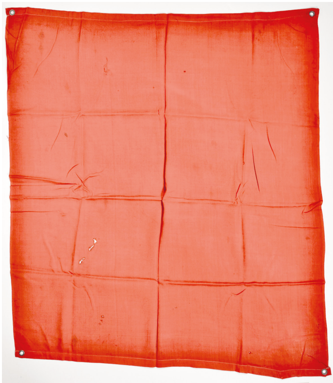
Рис. 9. Флаг, водруженный над мысом Херсонский при освобождении Крыма советскими войсками. Из коллекции ВМАИВиВС. Фото И. А. Садовой