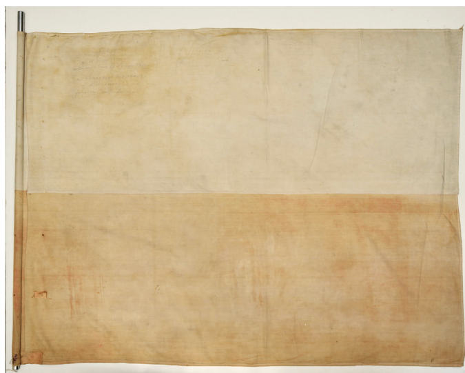
Рис. 12. Польский флаг, водруженный при освобождении г. Варшавы. Из коллекции ВИМАИВиВС. Фото И. А. Садовой

города Яновским. В архиве ВИМАИВиВС сохранился акт о его передаче «братскому советскому народу как символ[а] борьбы и победы» 16 .