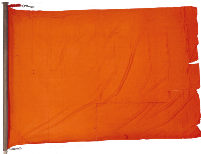
Рис. 11. Флаг, водруженный советскими войсками при полном освобождении г. Таллина. Из коллекции ВИМАИВиВС. Фото И. А. Садовой