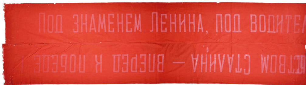
Рис. 5. Флаг, изготовленный из транспаранта. Водружен советскими войсками при освобождении г. Выборга. Из коллекции ВИМАИВиВС.