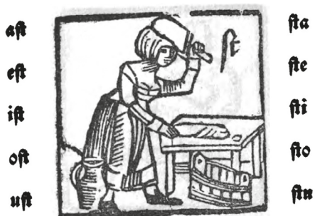
Рис. 5. Иллюстрация звука, произнесение которого похоже на звук при отбивании (или рубке) мяса [Jordan 1533]