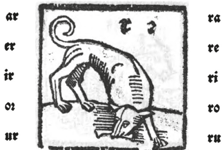
Рис. 4. Визуализация звука [r] с помощью рычащей собаки [Jordan 1533]