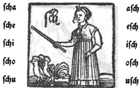
Рис. 6. «Женщина, отгоняющая гусей»: визуализация звука [ʃ] [Jordan 1533]