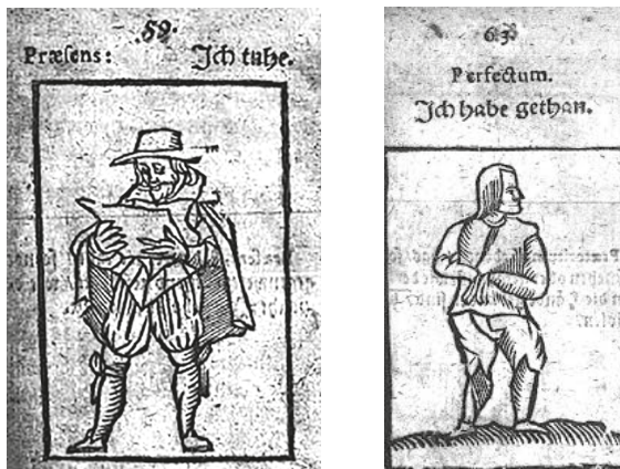
Рис. 8. Инсценировочная визуализация: слева — Praesens, справа — Perfekt [Olearius 1630: 59–60]

Для противопоставления настоящего и прошедшего времени автор предлагает использовать следующие картинки-инсценировки (рис. 8):