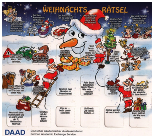
Рис. 4. Пример дидактической (педагогической) коммуникации

Примеры, приведенные на рис. 3 и 4, весьма информативны для носителей не только немецкой, но и других культур. Из этих креолизованных текстов разных типов, бытующих в разных коммуникативных средах и служащих реализации разных дискурсивных стратегий, реципиент извлекает значительный объем разнородных сведений не только о времени, но и о традиционно используемых в конкретный период предметах, об их символике, о сути события, о котором идет речь в креолизованных текстах, о локализации этого события в пространстве и времени, а также в системе ценностей, в картине мира коллективного субъекта как носителя немецкого языка и культуры. Кроме того, тексты содержат сведения