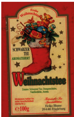
Рис. 3. Пример бытовой коммуникации

мости интерпретативности как потенциальной множественности прочтений воспринимаемой информации разными субъектами. Следствием из обозначенной связки тенденций можно признать потребность в солидаризации с малыми группами, в консолидации отдельных субъектов в пределах малой группы, которые, в свою очередь, возможно, обусловлены тенденцией к атомизации общества, причем не столько на отдельные личности, сколько на малые группы, о чем свидетельствует сегодняшняя психосоциальная структура интернет-сообщества.