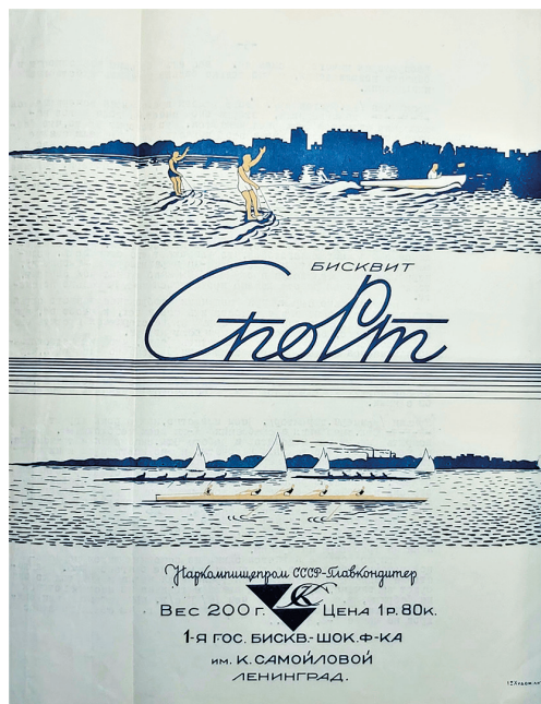
Упаковка от бисквита «Спорт».

Рашель, 1941 Рифленые, 1942 Родина, 1943 Ромашка, 1942 Ромовая, 1941 С Новым годом, 1941 Серенада, 1942 Спорт, 1941 Стандарт (шоколад), 1941 Стратостат, 1941 Тачанка, 1942 Трюфели, 1942 Тузик, 1942 Тянушка, 1943 Уралмаш, 1943 Фестиваль, 1942 Чапаев, 1941 Чернослив в шоколаде, 1941 Шоколадные батончики, 1941 Эсмеральда, 1941