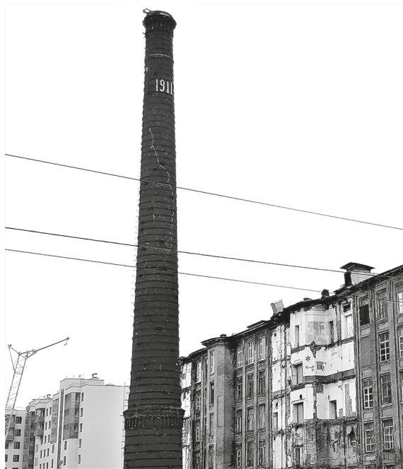
Территория бывшей фабрики «Ландрин» (в годы войны — имени Микояна).