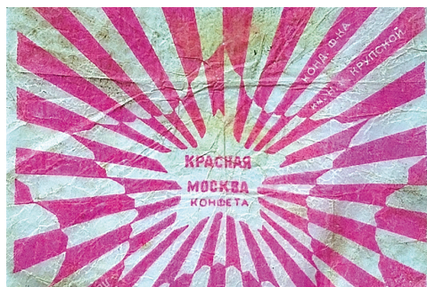
Обертки от блокадных конфет.

ного человека» в летных частях Карельского фронта «на самолетах фронта и на действующих самолетах тыла на случай аварий и вынужденных посадок». Помимо сгущенного молока, мясных консервов, галет паек предусматривал 300 г шоколада, 400 г сахара и 800 г печенья («на случай отсутствия шоколада») 91 . Тогда же вводилась в действие таблица замен продовольственных продуктов. Она предполагала замену 100 г шоколада «шоколадным набором» весом 100 г (который мог быть заменен 250 г печенья первого сорта, 125 г сахара или 100 г сгущенного молока с кофе или какао) 92 .