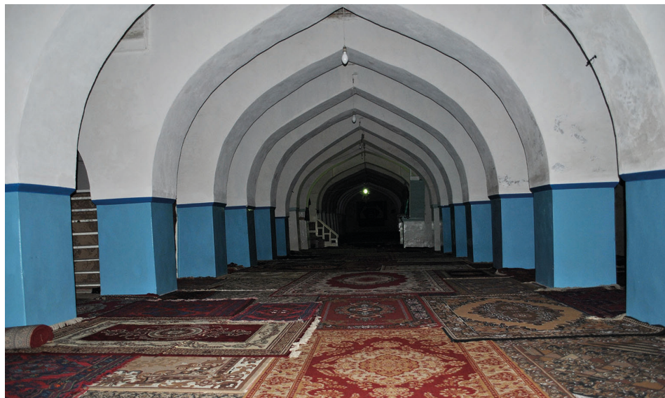
Рис. 3. Джума-мечеть. Центральный неф.

данное сооружение возводилось арабами в восьмом веке сразу как мечеть, а очень близкое сходство с христианской базиликой объясняется ее подражанием известной Большой мечети халифа ал-Валида (705–715 гг.) в Дамаске, перестроенной им в 708 г. из христианской базилики 39 . Однако ориентировка мечети по оси восток — запад, ее форма, конструкция нижней части стен, характерная для кладок VI–VII вв., целый ряд выявленных нами принципиальных отличий конструктивного характера и деталей интерьера, не укладываются в идею о том, что дербентская Джума-мечеть — это подражание более ранней дамасской мечети ал-Валида.