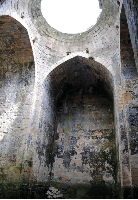
Рис. 7. Подкупольное пространство крестообразного храма.