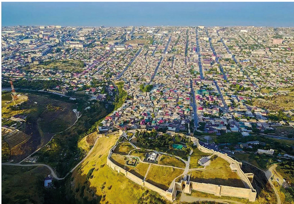
Рис. 1. Цитадель Нарын-Кала и вид на город