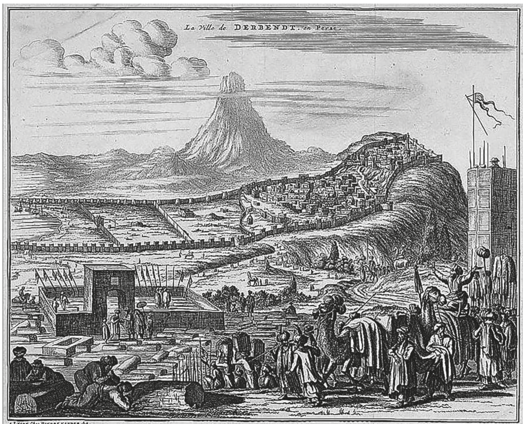
Рис. 2. Первое известное изображение Дербента. Гравюра А.Олеария. 1638 г. [Хан-Магомедов С.О. Дербент. Горная стена. Аулы Табасарана, 1979. С. 18–19]

дней памятника раннехристианской монументальной архитектуры. Первый из них представлен крупным трехнефным зданием базилики (с 733 г. и до настоящего времени — Джума-мечеть), расположенной в древних кварталах старой части города средневекового Дербента — шахристане. Здание имеет в длину 68 м, ширину 17 м и ориентировано по оси восток — запад (рис. 3). Его отождествляют с монументальной христианской базиликой VI–VII вв. 37 , перестроенной позднее знаменитым арабским полководцем VIII в. Масламой ибн Абд ал-Меликом в Джума-мечеть. Арабские и местные источники действительно сообщают о больших строительных работах Масламы в Дербенте в 115 г. хиджры (733–734 г.) 38 и упоминают о перестройке Джума-мечети из христианского храма. Но существует также мнение, что