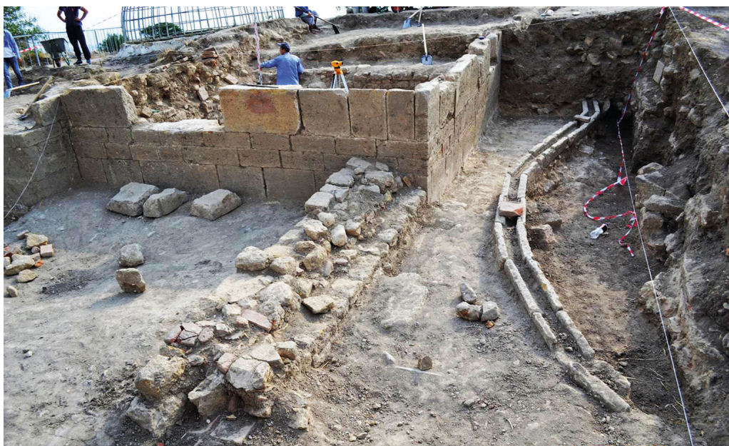
Рис. 5. Водовод, связанный с водохранилищем, в слоях XVIII–XIX вв. Раскопки 2013 г.

Ярким свидетельством этому служат материалы раскопок четырех крупных архитектурных комплексов, почти вплотную примыкающих к северо-западной стороне крестообразного сооружения и очень четко документирующих время его функционирования в качестве водохранилища. При раскопках этих монументальных комплексов дворцовой архитектуры «основные работы велись в северо-западной наиболее возвышенной части цитадели, рядом с большим водохранилищем» 48 , где выявленные нами керамические и каменные водоводы отмечены лишь в слоях архитектурных комплексов конца XVI столетия и XVII–XIX вв. (рис. 5).