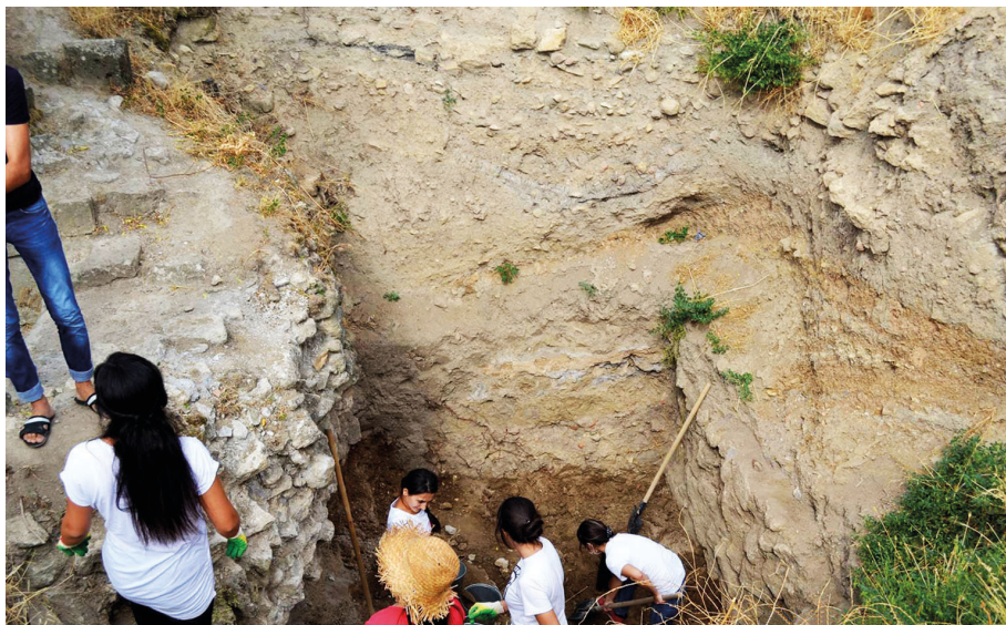
Рис. 4. Средневековые культурные слои с наружной стороны стен крестообразного храма. Раскопки 2013 г.

ной: три стороны по 4 м, одна — 6 м) перекрыты стрельчатыми сводами. Центральная часть цистерны перекрыта куполом диаметром 5 м. Общая высота цистерны до верха купола превышает 10 м» 43 .