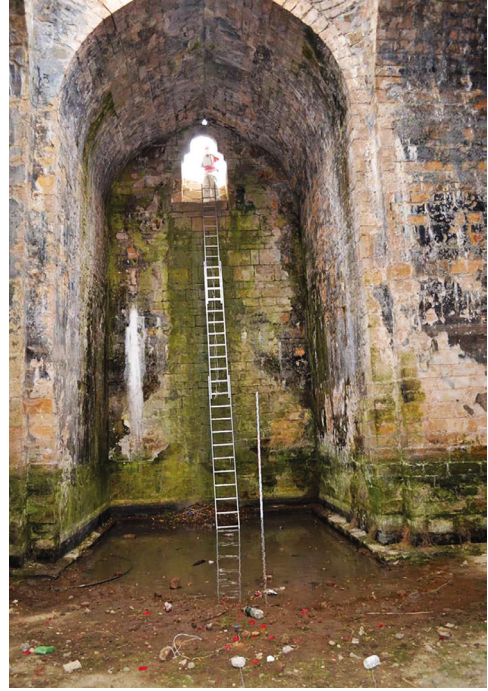
Рис. 8. Северный рукав крестообразного храма.

характерно для раннесредневековых кладок Дербента. Лабораторные исследования штукатурки, проведенные специалистами института «Спецпроектреставрация» Министерства культуры Российской Федерации 49 , показали, что два верхних слоя внутренней облицовочной штукатурки сооружения имеют следы поражения водными микроорганизмами, возникшие от постоянного контакта с водной средой, то есть они появились в период использования данного памятника в качестве водохранилища, а самый древний, нижний, слой, имеющий светло-розовую окраску, подобных поражений, связанных с соприкосновением с водой, не имеет. Данные письменных источников, материалы археологических раскопок и результаты микробиологических исследований, сопоставленные с крестообразной формой сооружения, которая строго ориентирована по сторонам света и имеет планировку, абсолютно нетипичную для местных водохранилищ Дербента, сохранивших на протяжении всего раннесредневекового и средневекового периодов только прямоугольную и квадратную форму, позволяют утверждать, что первоначальное назначение крестообразного сооружения цитадели было не хозяйственное, а религиозное. Представляется вероятным, что его надо отождествлять с крестообразным раннесредневековым христианским храмом, возведенным в цитадели Дербента во второй половине V в., когда албанский царь Ваче II превратил город в главный