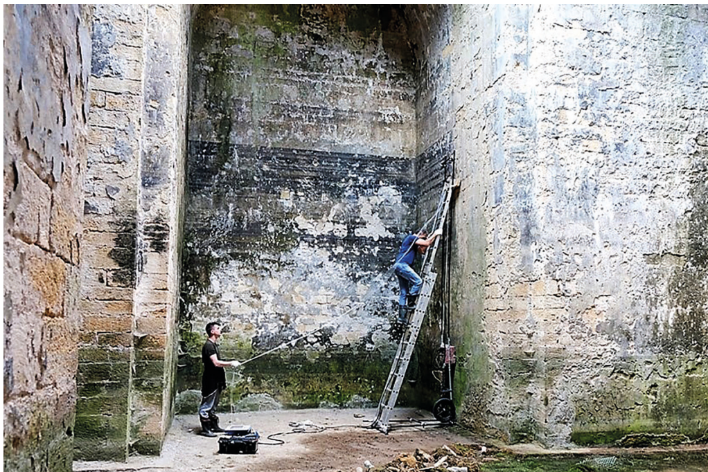
Рис. 9. Геоададное сканирование стен храма. 2020 г.