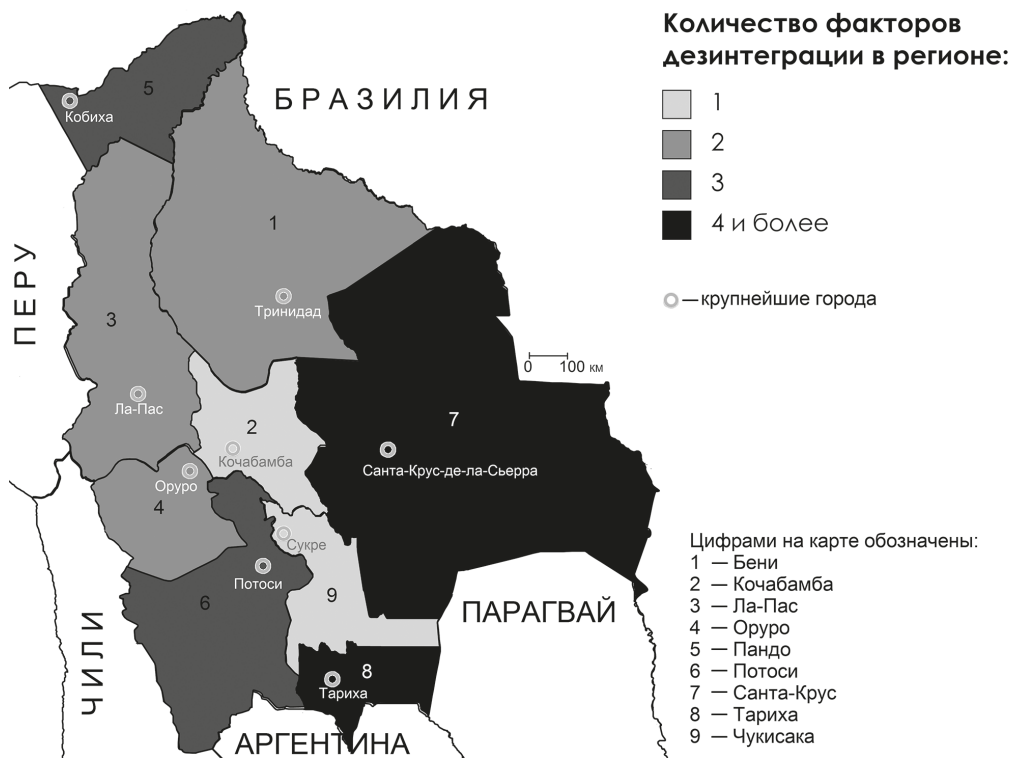
Рис. 2. Риски пространственной дезинтеграции по департаментам Боливии в середине 2010-х годов (составлено авторами)

Принимая во внимание сложный путь построения государственности Боливии, раскол между горным западом и равнинным востоком кажется вполне объяснимым. Инфраструктурным ядром равнинного востока, имеющим самый высокий уровень экономического развития, специфичный расово-этнический состав, политические элиты с особым взглядом на пути дальнейшего развития является департамент Santa-Cрус.