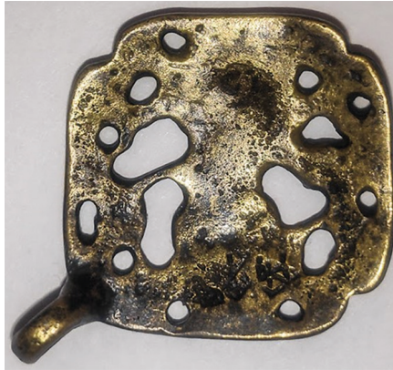
Рис. 3. Обратная сторона амулета со следами позолоты и рунической надписью.

в соответствии с названием данных рун [Добровольский, Дубов, Кузьменко, 1991, с. 46–47]. В «Старшей Эдде» валькирия Сигрдрива советует Сигурду дважды вырезать на рукояти меча руну t ( Týr ), символизирующую победу и названную в честь бога Тюра, 12 а на ногте — руну n ( Nauð ) 13 в ее буквальном символическом значении — «нужда» [Olsen, 1916, s. 227–228; Старшая Эдда, 1963, с. 110].