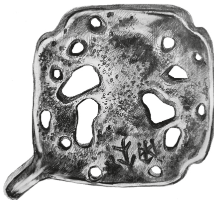
Рис. 4. Прорисовка оборотной стороны амулета и рунической надписи. Автор рисунка и фото И. А. Бондарь

Руна k^{21} из младшего рунического ряда имеет идеограмматическое значение «язва», в то время как k из старшего рунического ряда и англосаксонского рунического ряда означает «факел». 22 С точки зрения Добровольского, Дубова и Кузьменко, использование этой руны в магических целях, напрямую связанное с ее значением, встречается в надписи старшими рунами на камне из Эллестада VII–VIII вв. из города Сёдерчёпинг. Исследователи, со ссылкой на В. Краузе, считают, что в данной надписи применена магия сочетания двух «неблагоприятных» рун: i (4 раза) и k (6 раз), которые нанесены на камень под рунической надписью [Добровольский и др., 1991, с. 49]. Авторы не исключают, что такая же комбинация могла быть нанесена на монету IX–X вв. из Козьянки, где руна k изображена в сочетании с тремя рунами i [Добровольский и др., 1991, с. 49]. Как «неблагоприятную» руну k интерпретирует А. Норден в исследовании надписи на мече из Логторы [Nordén, 1937, s. 181].