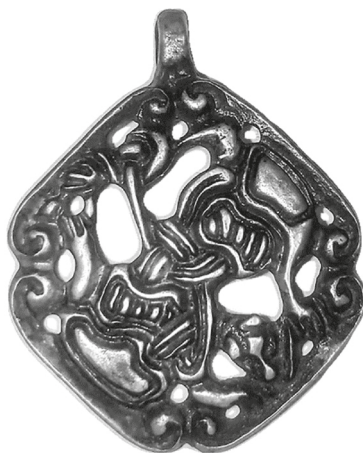
Рис. 1. Лицевая сторона скандинавского зооморфного амулета X в.

На реверсе подвески с прорезью, найденной у кольцевого городища близ села Алчедар, имеется руническое граффито 7 , выполненное скандинавскими рунами (рис. 2). Граффито является собой очень интересный образец рунической эпиграфики (рис. 4). Руническая надпись располагается вдоль левой верхней грани ромба на реверсе (рис. 2–4), что соответствует ее расположению на тыльной стороне правого верхнего «бугорка» аверса медальона (рис. 1), и занимает услов-