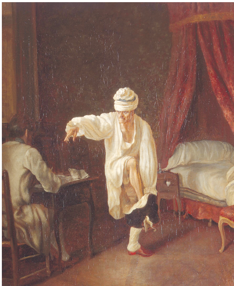
Рис. 1. Жан Гюбер. Утро Вольтера. 1750–1775. Государственный Эрмитаж, Санкт-Петербург

были распространены в гравюрах: вот Вольтер только что вылез из постели в ночной сорочке и колпаке и натягивает штаны, попутно давая указания своему секретарю (рис. 1), вот он пьет утренний кофе, вот он укрощает лошадь, вот правит кабриолетом, вот, прогуливаясь по окрестностям, остановился поговорить с крестьянами, вот он высаживает деревья, вот играет в шахматы, вот в домашней одежде принимает гостей (рис. 2). Помимо прочего, от героя и монарха великого писателя отличает и то, что он субъект не резонансного действия, а креативного процесса, растянутого во времени и скрытого от посторонних глаз. Сам замысел Гюбера показать Вольтера в действии предполагал не только прозаический, но и гротескный эффект. Вольтеру сцены не понравились своей комичностью. Однако именно она высвечивала его широчайшую популярность, обратной стороной которой была доступность его образа для праздного, приземленного, фамильярного и мелкого любопытства обычных людей: они с удовольствием обнаруживали, что в домашней обстановке Вольтер похож на многих из них. Здесь мы сталкиваемся с профанированием как приемом, подчеркивающим популярность персонажа и провоцирующим зрительскую эмпатию.