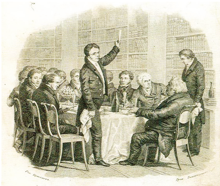
Рис. 5. Застолье у Смирдина. С рисунка Александра Брюллова [16]