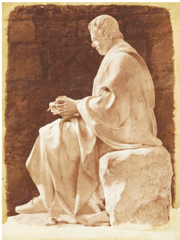
Рис. 6. Роберт Адамсон и Дэвид Октавиус Хилл. Статуя Вальтера Скотта работы Джона Роберта Стила. 1843–1847. Национальная галерея Шотландии, Эдинбург

Никто из современников не мог сравниться с великим шотландцем в литературной популярности, но феномен Скотта побуждал другие нации искать своих литературных кумиров, пусть и меньшего, местного масштаба. Наличие в отечестве великого народного писателя стало вопросом национального и государственного престижа. И Николай I соизволил определить такового среди своих подданных. В их рядах не было человека, лучше подходившего на роль русского Вальтера Скотта, чем Пушкин, выделявшийся своей громкой литературной славой, силой таланта, новаторства и исторического воображения, а также своими подражаниями шотландскому романисту, самыми оригинальными и яркими во всей русской литературе. В 1835 г. Белинский в панегирике Вальтеру Скотту, говоря о его непревзойденной всемирной славе и народности, из отечественных поэтов приводил в пример Пушкина как достигшего наивысшей славы и народности в пределах отечества [31, с. 264] 15 . Но царь не захотел оказывать Пушкину столь исключительную честь, и его выбор пал на Крылова. Это произошло еще в 1838 г., как показывает активное участие правительства в организации празднования крыловского юбилея.