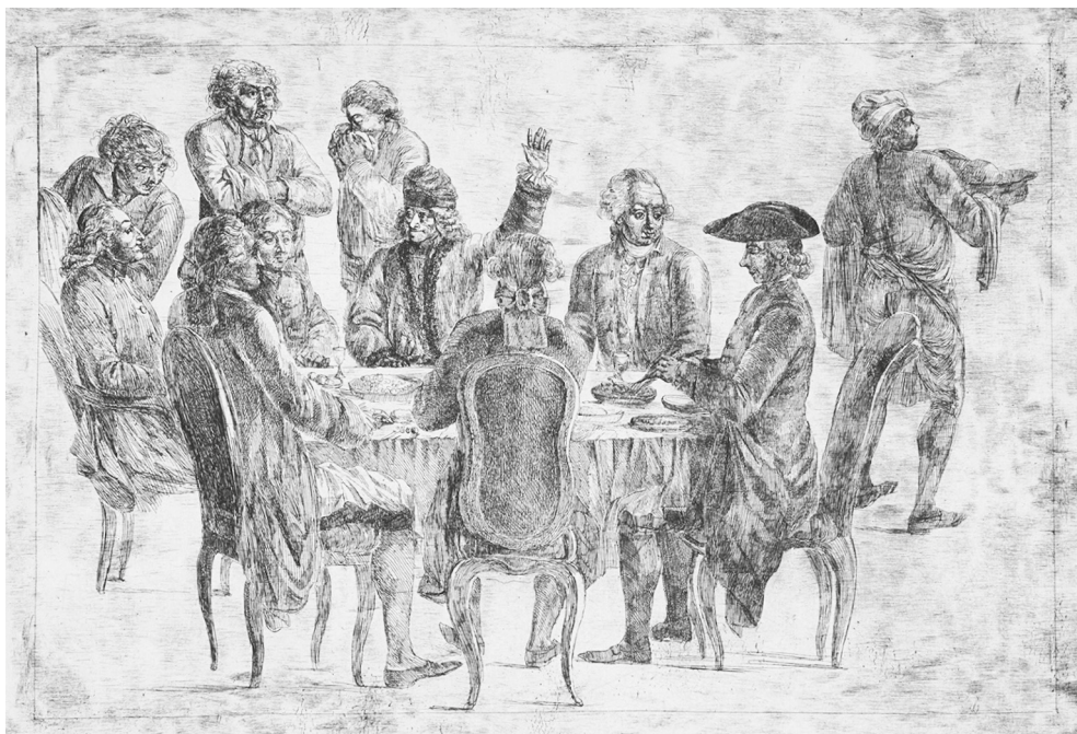
Рис. 2. Ужин философов. С картины Жана Гюбера. 1773–1775. Чикагский институт искусств, Чикаго

Серию Гюбера заказала Екатерина II 2 , для которой дружба с великими людьми была важнейшей составляющей ее амплуа просвещенной монархини.