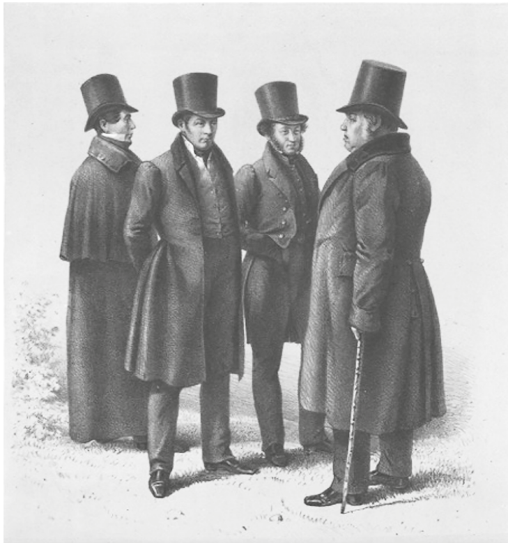
Рис. 4. Группа поэтов в Летнем саду. С этюда Григория Чернецова (1832) [10]

назвал Смирдина «достойным посредником между писателями и публикою» [12, с. 3]. Фаддей Булгарин вторил: «Он окрылил словесность, дал ей жизнь, разбудил публику и писателей, сдружил их» [13, с. 1187]. Смирдин заботился о внешней привлекательности изданий, но преуспел в удешевлении книг и увеличении их тиража, наладил снабжение книгами провинции, ускорил профессионализацию литературы, выплачивая постоянные и большие гонорары писателям 5 , хотя среди его авторов многие принадлежали к партии «литературных аристократов» и, в отличие от партии «литературной промышленности», не нуждались в творчестве как в главном источнике дохода 6 .