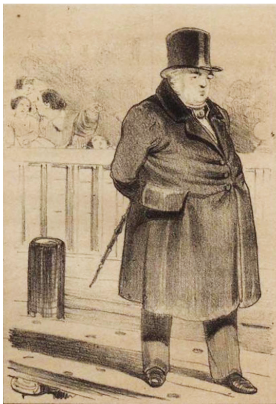
Рис. 9. Крылов идет по петербургской улочке. С рисунка Александра Агина [26]

Рисунки Агина, как и эстампы из альманаха «Новоселье», как и повторенный в гравюре и живописи этюд Чернецова «Группа поэтов в Летнем саду», как и картина художников школы Венецианова «Субботнее собрание у Жуковского», составили круг изображений Крылова, который во многом предвосхитил и предопределил описанную выше специфику творения Клодта. Помимо статуй Вальтера Скотта в Англии, эти графические и живописные изображения Крылова должны были служить Клодту источником вдохновения. Воплощение в формах городского памятника приватно-публичного образа поэта, которым он был известен многим современникам в своей обычной жизни, означало, что несобытийная социальная и частная современность получила право войти в историю. Первым проводником этого права выступил писатель.