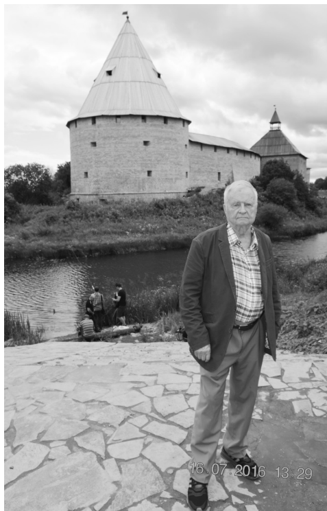
А. Н. Кирпичников на фоне восстановленной Стрелочной башни Староладожской крепости. Фото С. В. Белецкого, 2016 г.

Трудно поверить, что слова «неожиданно, безвременно покинул нас» могут относиться к уходу человека, который год назад перешагнул 90-летний жизненный рубеж.