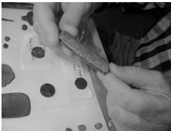
Находки из раскопа на Земляном Городище Старой Ладogi. Костяной гребень из материковой ямы. Фото А. И. Филюшкина, 2008 г.

В камералке было большое увеличительное стекло, используя которое Анатолий Николаевич мог долго рассматривать все особенности заинтересовавшей его находки.