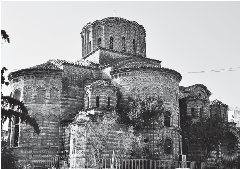
Рис. 10. Церковь Пророка Илии (1360-е – 1370-е гг.). Вид с северо-востока. Фото автора, 2018 г.

воспроизводит купол церкви Святых Апостолов. Гранение апсид, пояс орнамента в их венчающих частях, чередование углубленных и плоских ниш, расположенных ярусами, находится в соответствии с тенденциями палеологовской архитектуры и напоминает столичные памятники — южную церковь монастыря Липса (конец XIII в.), парекклесий монастыря Паммакаристос (до 1310 г.). К столичным особенностям относится и техника кладки из чередования кирпича и камня. Орнаментальные мотивы, профилировка и способы заполнения ниш следуют салоницким образцам. Единственное, что выглядит чужеродным в церкви Пророка Илии и не встраивается в концепцию развития палеологовского зодчества — монументальность и лапидарность объемов. Однако эти особенности объясняются скорее спецификой заказа: храм, ктитором которого выступала императрица Анна Савойская, мать Иоанна V Палеолога, был прежде всего репре-