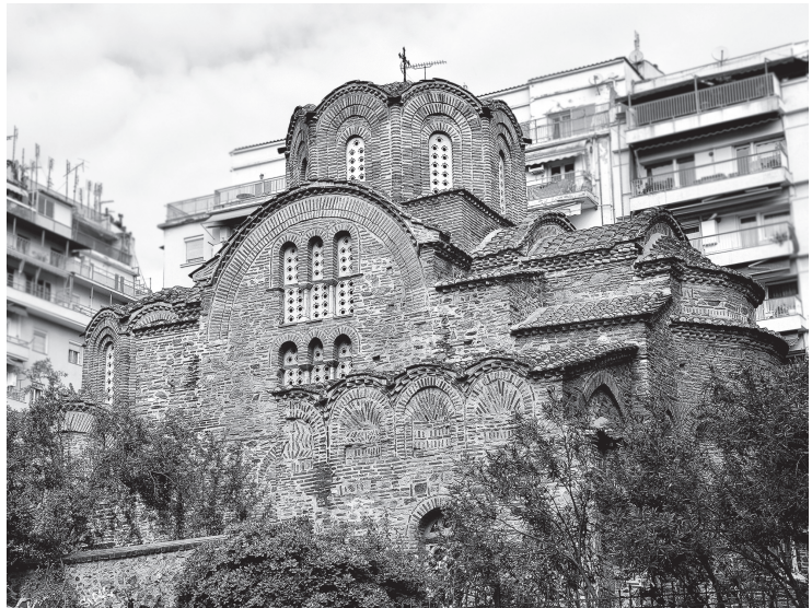
Рис. 1. Церковь Св. Пантелеймона (1295). Вид с юго-востока.

В самом раннем палеологовском памятнике Салоник — церкви Св. Пантелеймона (1295) 9 — при отсут-