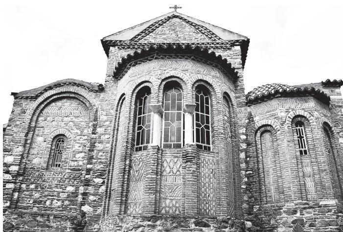
Рис. 7. Церковь Свв. Таксиархов (1350-е – 1370-е гг). Восточный фасад. Фото автора, 2018 г.

орнаментами, трехгранная апсида жертвенника, артикуляция восточного торца южной галереи слепой аркой — сокращенная и упрощенная конфигурация форм узнаваемого прототипа (Рис. 8). Однако при сохранении внешнего подобия, в церкви Таксиархов