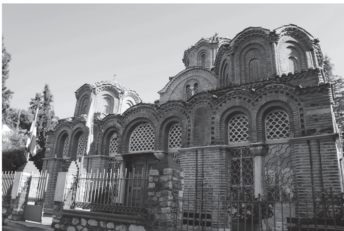
Рис. 3. Церковь Св. Екатерины (1315–1320). Западный фасад. Фото автора, 2018 г.

Церковь Святых Апостолов дает классический пример палеологовского стиля Салоник: пятиглавый крестово-купольный храм на четырех колонках, с вимой, с большой широкой галереей и экзонартексом формально воспроизводит лучшие константинопольские образцы. Характерные особенности салоникинского храма, отличные от столичной практики, — новые пропорции, ритм, силуэт, соединенные с новой, богатой фактурой фасадов. Ковровое заполнение кирпичным декором в данном случае можно рассматривать