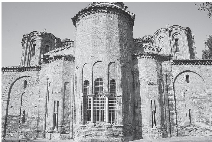
Рис. 8. Церковь Свв. Апостолов (1310–1314). Восточный фасад. Фото автора, 2018 г.

Другой вариант продолжения местной традиции, где салоницкие стандарты первой трети века находят более последовательное развитие, представлен в кафоликоне монастыря Влададон (1351–1371). В объемно-пространственной структуре сохраняется ступенчатая пирамидальная композиция, достигаемая за счет обнесения основного крестово-купольного объема галереями, в то время как малые