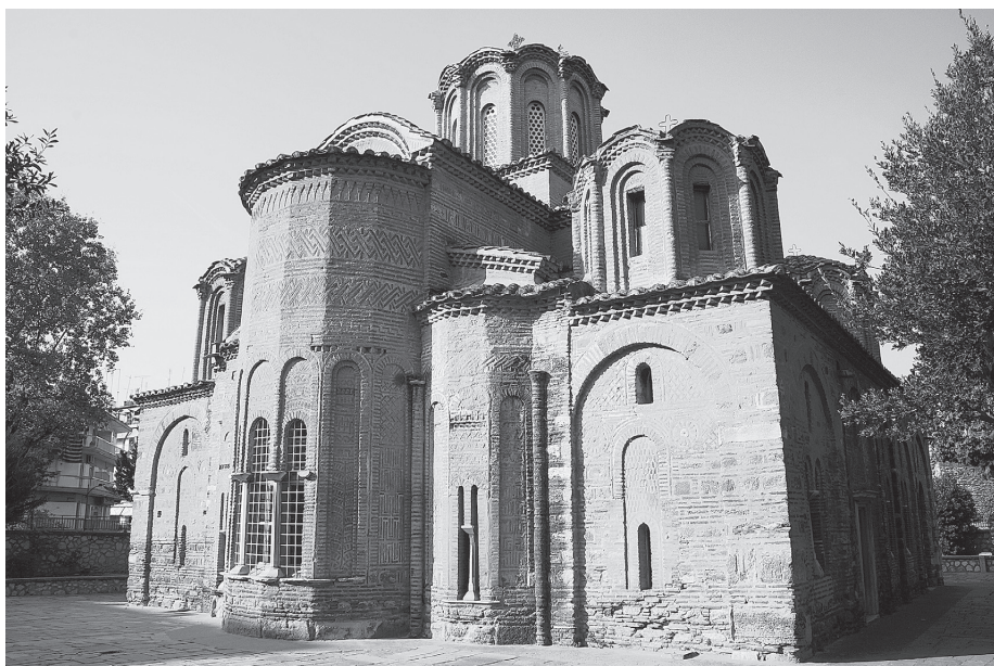
Рис. 5. Церковь Свв. Апостолов (1310–1314). Вид с северо-востока.

Керамопластическая декорация в локальной практике стала новшеством палеологовского периода, как и техника кладки клуазоне, в которой построены все палеологовские храмы Салоник, кроме церкви Преображения (сер. XIV в.) 13 и Пророка Или (1360-е – 1370-е гг.). Появление этих особенностей обусловлено влиянием Эпира. Однако в отличие от широкого видового и иконографического ряда эпирских орнаментов (пояски вырезного кирпича (дисепсион, S-образные мотивы), фиалостомия, широкие полосы opus reticulatum , включение рельефов и керамических икон) 14 , декоративный арсенал Салоник ограничивается кирпичными орнаментами (не считая нескольких керамических вставок в церкви Св. Екатерины), он довольно простой