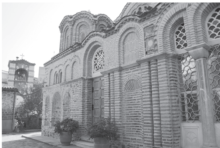
Рис. 4. Церковь Св. Екатерины (1315–1320). Северный фасад. 2018 г.