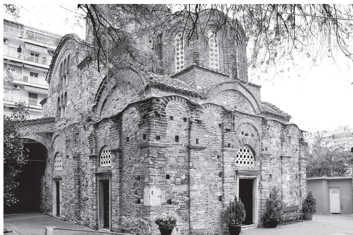
Рис. 2. Церковь Св. Пантелеймона (1295). Вид с северо-запада. Фото автора, 2018 г.

неглубокими нишами (Рис. 1), что отсылает к традициям Эпира, западный фасад — в классической манере, пилястрами, ограниченными карнизами, которые, однако, проходят не у основания несущих арок сводов несохранившейся галереи, а значительно ниже (Рис. 2). Артикуляция алтарной апсиды нишами только иконографически ориентируется на столичную традицию, поскольку их соотношение с архитектурной