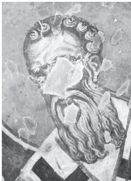
Рис. 9. Церковь Св. Димитрия в Прилепе. Св. Афанасий Великий. Конец XIII в.

Эти общие черты стиля, а также некоторые индивидуальные особенности мы обнаруживаем в сохранившихся изображениях святителей в апсиде церкви Св. Николая в Вароше. Так, в обоих храмах очень похожи лики св. Афанасия, включая такие детали, как форма рта, завитков волос и прядей бороды, рисунок надбровных дуг с каплевидной складкой над темной впадинкой переносицы, седые кисточки у начала бровей (Рис. 9, 10). В двух образах св. Иоанна Златоуста нет полного совпадения в рисунке стилизованных морщин, но похожи другие детали, например, специфическая форма мешков под глазами и треугольных впадин на щеках (Рис. 12, 13). В лике св. Иоанна Златоуста из церкви Св. Димитрия характерные двойные линии морщин на висках и лобной доле сделаны так же, как у св. Афанасия из церкви Св. Николая (Рис. 10, 11). У св. Иоанна Златоуста из церкви Св. Николая и св. Григория Чудотворца из церкви Св. Димитрия одинаковый рисунок ушей с длинной узкой мочкой, форма глаз, рта и дугообразных бровей, очень похожи тройные белильные черточки у внешних углов глаз (Рис. 12, 13). Аналогична сама техника письма, сочетающая линейную проработку и объемную моделировку, сделанную активными, словно немного неряшливыми мазками, в том числе цветными. Все это позволяет предположить, что изображения святителей в апсидах обоих храмов выполнил один художник.