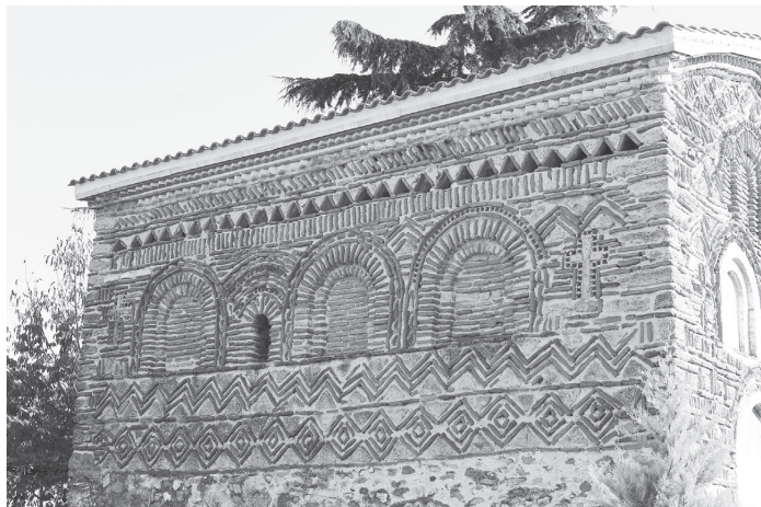
Рис. 2. Церковь Св. Николая в Прилепе. Северный фасад. 1284–1298.

В 1990 г. были проведены технико-технологические исследования 5 , которые установили наличие двух фаз росписи с разными составами штукатурки: к одной относятся фрески алтаря и наружные росписи в лонетах западного фасада, ко второй — все остальные росписи наоса. В соответствии с этими новыми данными, П. Милькович-Пепек пересмотрел высказывавшиеся ранее предположения и убедительно обосновал датировку концом XIII в. второго этапа строительства и обеих фаз росписи, осуществленных по заказу Вегоса Капзы с небольшим промежутком 6 . Поскольку в ктиторовской надписи упоминается императорская чета Андроника и Ирины, поженившихся в 1284 г., Милькович-Пепек считает эту дату нижней границей для второго этапа строительства и первого этапа росписи, завершённой другими мастерами в 1298 г.