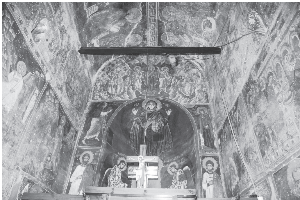
Рис. 8. Церковь Св. Николая в Прилепе. Росписи восточной части. 1284–1298

В. Ристич датировал композицию «Поклонение жертве» в главной апсиде концом XII в., а фрески нижней части наоса, включая предалтарные столпы, — временем около 1290 г. 35 В современных обзорных работах по Македонской живописи XIII в. до сих пор не предпринимались попытки уточнить датировку фресок нижней части храма 36 .