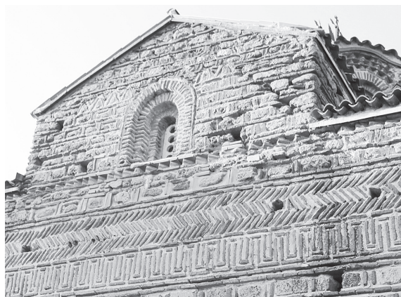
Рис. 6. Церковь Св. Димитрия в Прилепе. Южный фасад. Конец XIII в.

Купол церкви Св. Димитрия тоже обнаруживает мотивы, характерные для эпирской архитектуры конца XIII в. (Рис. 5). Его двенадцатигранный барабан богато украшен. Каждый угол отмечен оштукатуренными колонками с трапециевидными капителями. Каждая грань оформлена как плоская арочная ниша с двухступчатой профилировкой, до половины высоты которой доходит окно с арочным завершением. Аналогичным образом оформлен центральный проем тройного окна на северном фасаде. Архивольты окон барабана обведены одним рядом кирпичей, а над двухступчатым арочным завершением каждой грани имеется еще по три ряда декоративных архивольтов, с чередованием разных мотивов. На одной грани это три ряда поребрика, оконтуренного рядами кирпичей, на соседней грани один или два ряда поребрика заменяются цепочкой фиалостомиев. Такое специфическое оформление арочных завершений граней барабана также перекликается с аналогичными мотивами в оформлении фасадов церкви Св. Димитрия и находит прямые аналогии в оформлении архивольтов ниш на фасадах соседней церкви Св. Николая. Все это заставляет нас отказаться от