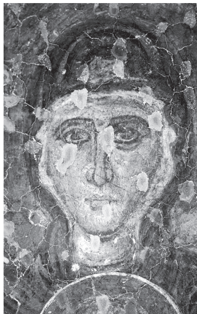
Рис. 15. Церковь Св. Димитрия в Прилепе. Богородица. Фреска в конхе апсиды. Конец XIII в. Фото А. В. Захаровой, 2019 г.