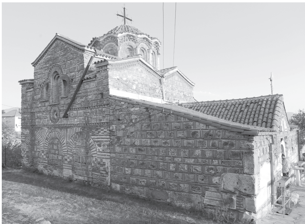
Рис. 3. Церковь Св. Димитрия в Прилепе. Вид с северо-запада. Конец XIII в.

В храме Св. Димитрия кладка всех фасадов выполнена не особенно аккуратно, в технике клуазоне (Рис. 3, 4). Между рядами прямоугольных каменных блоков проходят одинарные или двойные ряды горизонтально положенных кирпичей, каждый камень отделяется от соседнего двумя вертикально поставленными кирпичами. На всех фасадах в нижних частях положены более крупные каменные блоки (в том числе сполійные), в верхних — более мелкие, с большим количеством кирпича. Там, где используются камни неправильной формы, мастера добавляют несколько целых или битых кирпичей,