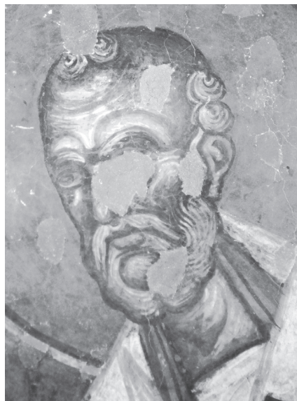
Рис. 13. Церковь Св. Димитрия в Прилепе. Св. Григорий Чудотворец. Конец XIII в. Фото Д. О. Цыпкина, 2010 г.

Помимо более ранних росписей Манастира, аналогичные примеры можно встретить и среди икон, и среди росписей других храмов в Македонии. Так, в церкви Св. Георгия в Оморфоклисии близ Кастории, датированной по надписи промежутком