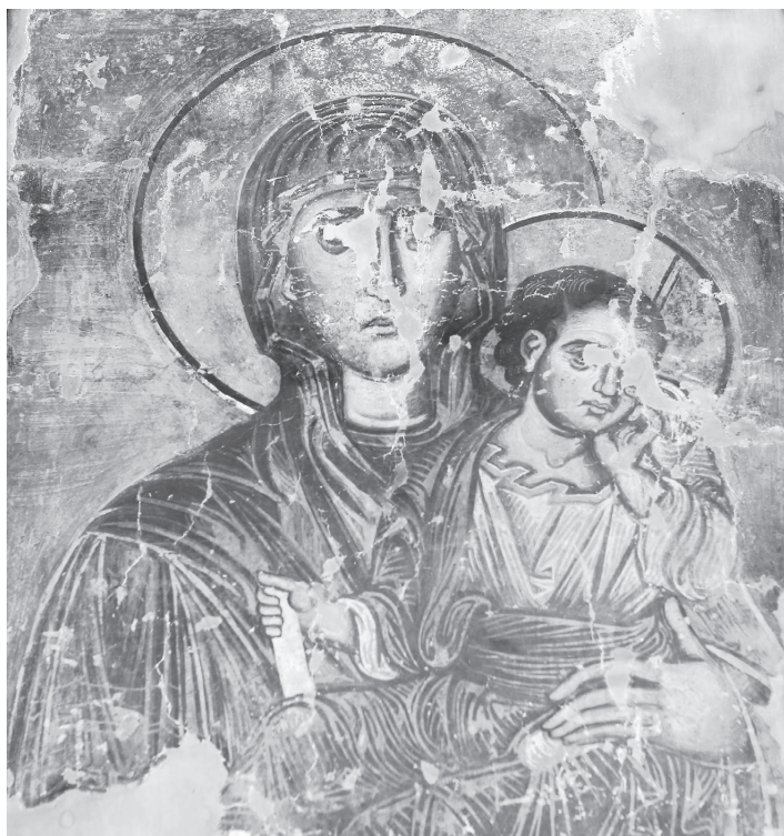
Рис. 14. Церковь Св. Димитрия в Прилепе. Богородица с Младенцем. Фреска на северном алтарном столпе. Конец XIII в. Фото А. В. Захаровой, 2019 г.

К этому же направлению принадлежат и фрески на алтарных столбах церкви Св. Димитрия в Вароше, изображающие Богородицу Одигитрию и св. Димитрия (Рис. 14, 17). Ктиторская надпись на северном столпе называет имена раба Божия Андроника и Ирины, очевидно, оплативших создание этих фресок, а возможно и какие-то