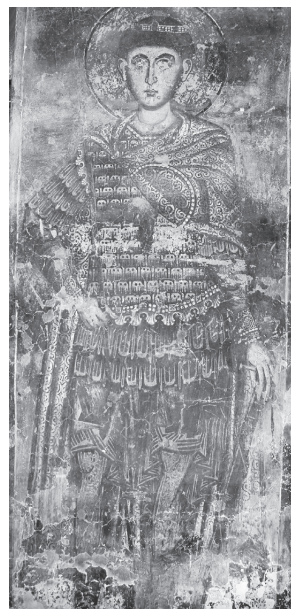
Рис. 17. Церковь Св. Димитрия в Прилепе. Св. Димитрий. Фреска на северном алтарном столпе. Конец XIII в. Фото А. В. Захаровой, 2019 г.

Росписи этих храмов сохранились фрагментарно и лишь частично расчищены. Это большие ансамбли, в работе над которыми, вероятно, принимало участие по несколько мастеров. Как и в македонской монументальной живописи