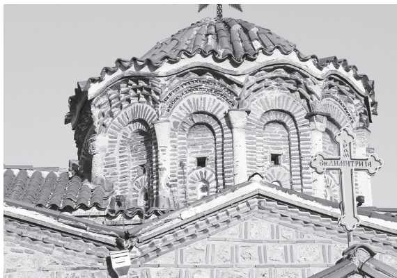
Рис. 5. Церковь Св. Димитрия в Прилепе. Купол. Конец XIII в.

Некоторые из этих специфических эпирских мотивов встречаются и в храме Св. Димитрия. На южном фасаде над окном были полосы зигзагов с треугольными камнями, вставленными в промежутки между кирпичами (Рис. 6). Сочетание обводки из поребрика и фиалостомиев с промежуточными рядами кирпича встречается в завершении щипца над главной апсидой, а также в завершении граней барабана купола.