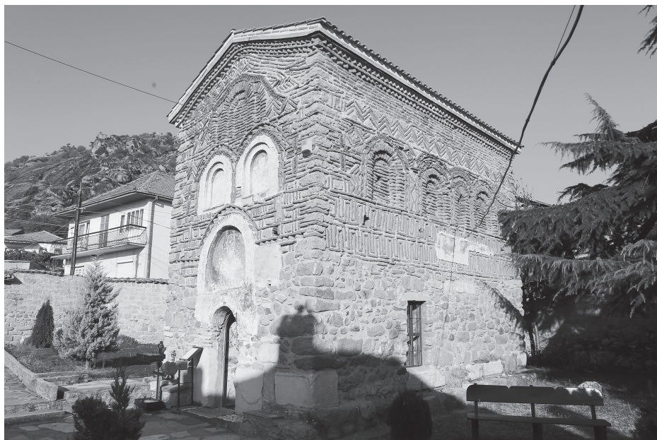
Рис. 1. Церковь Св. Николая в Прилепе. Вид с юго-запада. 1284–1298. Фото А. В. Захаровой, 2019 г.

Росписи апсиды и наоса заметно различаются по стилю, что послужило причиной формирования двух основных точек зрения на датировку фресок ансамбля. Одни исследователи так или иначе соотносили два слоя живописи с двумя строительными фазами: фрески апсиды датировали концом XII или первой половиной XIII в., а остальные росписи — 1298 г., по ктиторовской надписи 3 . Другие исследователи считали все