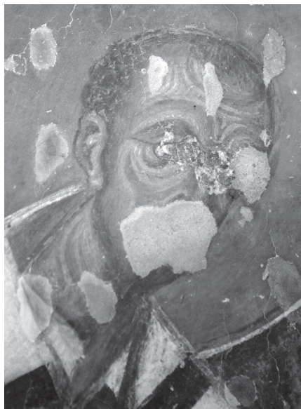
Рис. 11. Церковь Св. Димитрия в Прилепе. Св. Иоанн Златоуст. Конец XIII в.

Образы Богоматери в алтарных частях двух церквей тоже очень похожи (Рис. 14–16). Особенно близкое сходство обнаруживают лики Богородицы в конхах апсид (Рис. 15, 16). Овал лица удлинён и резко сужается к подбородку. Длинный и совершенно прямой нос очерчен параллельными линиями, переходящими в изящное закругление каплевидного кончика и высоких крыльев. Прихотливый изгиб губ повторяется почти буквально в обеих фресках, так же как и форма длинных саблевидных бровей с треугольной впадинкой между ними, и форма огромных глаз с немного оттянутыми вниз внешними углами. Несмотря на то, что поверхность фрески в церкви Св. Димитрия пострадала от пожара, видно, что объём лика был так же гладко и тщательно моделирован постепенными высветлениями, особенно активными вокруг носа, губ и на подбородке, как и на фреске в церкви Св. Николая.