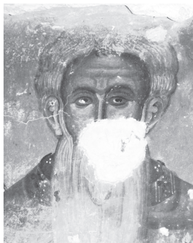
Рис. 20. «Красная церковь» в Вулгарели. Св. Иларион. 1295/1296.

Однако в росписях наоса церкви Св. Николая в Вароше можно обнаружить и черты, сближающие их с другой традицией — «тяжелым» или «кубистическим» стилем Михаила и Евтихия Астрападов, расписавших церковь Богородицы Перивлепты в Охриде в 1294/1295 г. 48 В некоторых евангельских сценах в церкви Св. Николая коренастые фигуры имеют подобные тяжеловатые пропорции и крепкие головы на коротких шеях, обильные драпировки одежд тщательно моделированы. Однако в них нет гротескного подчеркивания объема, характерного для росписей Перивлепты. В обоих храмах часто появляются персонажи,