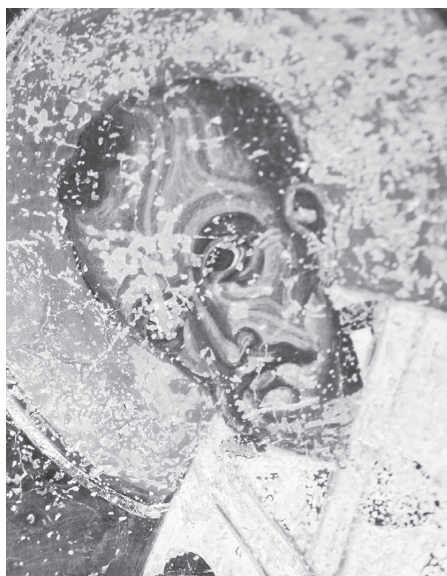
Рис. 12. Церковь Св. Николая в Прилепе. Св. Иоанн Златоуст. 1284–1298. Фото Д. О. Цыпкина, 2010 г.

Трудно сказать определенно, были ли фрески в апсидах двух соседних храмов в Вароше выполнены одним или двумя мастерами, работавшими и там, и там; последнее представляется нам более вероятным. Как было установлено в результате технико-технологических исследований в церкви Св. Николая, в апсиде была использована одна и та же по составу штукатурка, при этом по дневному шву определяется, что сначала были написаны изображения Богородицы и архангелов в верхней части, затем — святители в нижней части 37 . Несмотря на некоторые различия в типажах и манере моделировки изображений нижней и верхней частей апсид в обоих храмах, все они ориентированы на