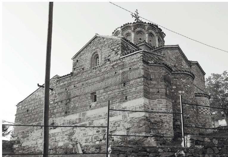
Рис. 4. Церковь Св. Димитрия в Прилепе. Вид с юго-востока. Конец XIII в. Фото А. В. Захаровой, 2019 г.

Хотя декор храма Св. Николая намного более богатый и разнообразный, чем в церкви Св. Димитрия, в них можно отметить некоторые общие мотивы. Одинаково сделаны