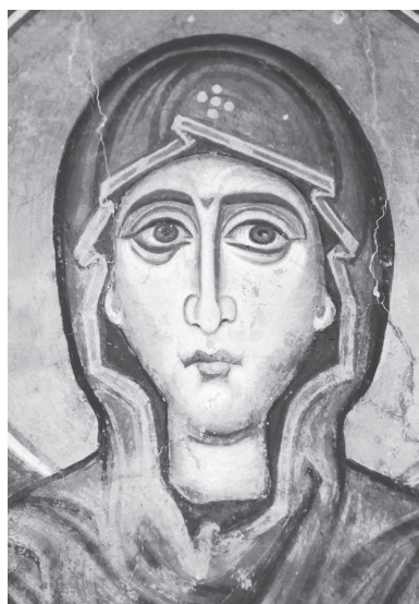
Рис. 16. Церковь Св. Николая в Прилепе. Богородица. Фреска в конхе апсиды. 1284–1298.

другие работы в храме 43 . На наш взгляд, в виду отсутствия в надписи каких-либо титулов, отождествление ктиторов с Андроником II Палеологом и Ириной Монферратской не может быть принято, однако связывавшаяся с их именами датировка после 1284 г. или ок. 1290 г. кажется вполне подходящей по стилю этих изображений. Небольшие отличия в рисунке черт ликов не позволяют приписать эти образы художникам, работавшим в апсидах двух храмов в Вароше, однако разница не столь существенна. Остальные образы отдельных святых в нижнем ярусе церкви Св. Димитрия также могут быть отнесены примерно к этому же времени 44 . Они не представляют собой единого ансамбля и, вероятно, делались от случая к случаю на протяжении нескольких десятилетий. Явно вторичным по отношению к образу св. Димитрия на алтарном столпе выглядит второе изображение великомученика, ведущего за руку соименного ему ктитора, Димитрия Мисинополита. Эта фреска на северной стене южного нефа значительно уступает по качеству живописи всем рассмотренным выше и, вероятно, была сделана одной из последних.