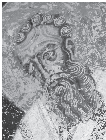
Рис. 10. Церковь Св. Николая в Прилепе. Св. Афанасий Великий. 1284–1298.