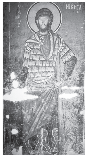
Рис. 18. Церковь Св. Николая в Манастире. Св. Никита. 1271. Фото А. В. Захаровой, 2019 г.