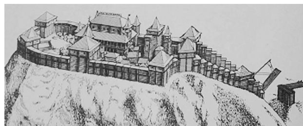
Рис. 3. Реконструкция замка в Любече (70–80-е гг. XX в.).

и поливными керамическими дисками» 17 . На территории замка была небольшая «башнеобразная деревянная церковь, крытая шатром с небольшой главой, обитой свинцовыми пластинами» 17 .