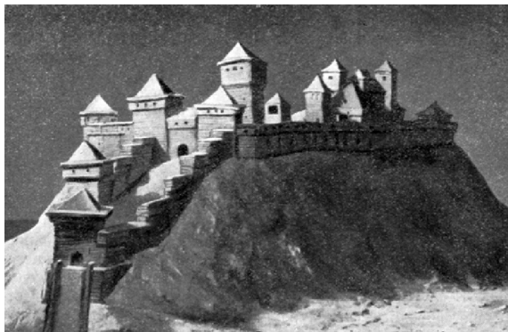
Рис. 2. Реконструкция замка в Любече (1966 г.).

В статье впервые подробно описываются замковые укрепления и постройки. Характеризуя укрепления замка, Б. А. Рыбаков отмечал, что они одновременно были и стенами, состояли из городен и примыкающих к ним изнутри вплотную жилых срубов с плоскими глиняными крышами. Въезд в замок начинался с подъемного моста, поднимаемого «жеравцем» и воротом, помещенными в особой башне. Главным сооружением замка был назван дворцовый комплекс длиной 40 м, шириной 9–13 м. Трехэтажное здание имело на втором этаже главный зал, «украшенный рогами