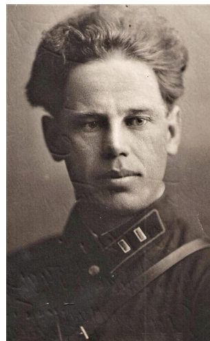
А. Н. Боголюбов после окончания Военной академии РККА им. М. В. Фрунзе. 19 августа 1931 г. Источник: Чувашский национальный музей. Ед. хр. ВМ 10028/11. Публикуется впервые

В данной статье предпринята попытка изложить краткую историографическую характеристику вновь обнаруженной монографии и определить ее место и значение в контексте научной и служебной деятельности генерала