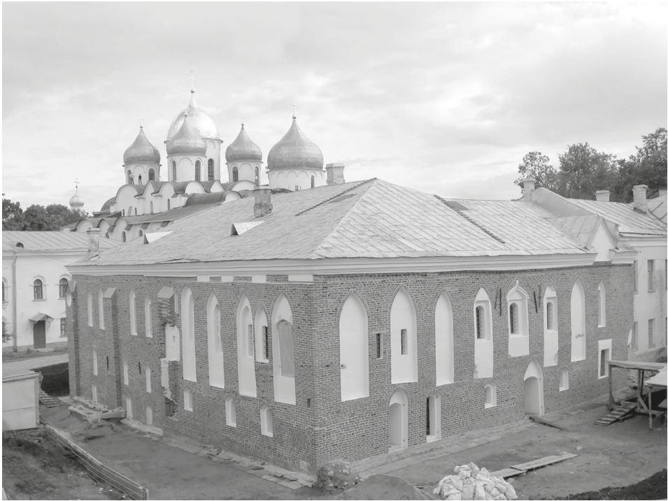
Рис. 1. Новгородская Владычная палата 1433 г. Вид с северо-запада.

Комплекс каменных построек на новгородском Владычном дворе, сложившийся в XIII — середине XV в., — уникальное явление в истории древнерусской архитектуры. Ни в одном городе Древней Руси не существовало столь сложного по структуре ансамбля каменных зданий, включавшего в себя как церковные сооружения, так и гражданские постройки различного назначения. Изучение построек новгородского Владычного двора оказывается актуальной задачей для понимания основных процессов, характерных для развития всей новгородской архитектуры XIII–XV вв.