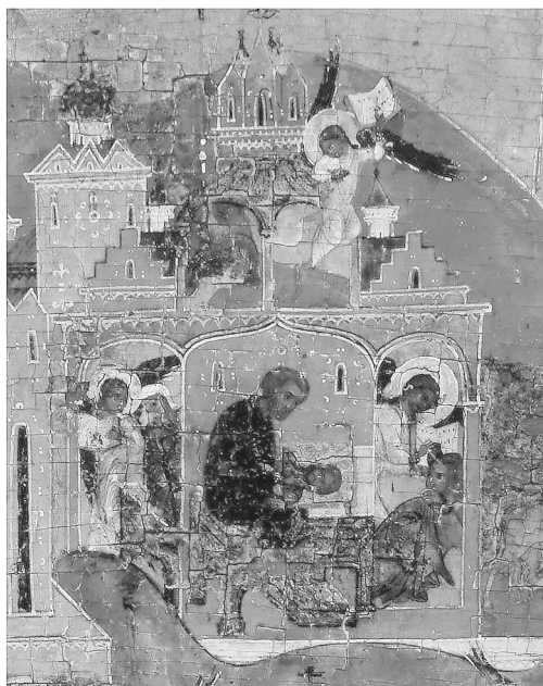
Рис. 3. Икона «Видение пономаря Тарасия». Новгородский государственный объединенный музей-заповедник. Последняя четверть XVI в. Фрагменты: а — постройка со ступенчатыми фронтонами на территории Владычного двора (палата 1433 г.); б — постройки со ступенчатыми фронтонами в Гончарском (Людином) конце.

печатной графике [12]. Очевидно, здесь мы также сталкиваемся с подобного рода явлением и представленная постройка — элемент архитектурного фона, а не изображение реального здания Владычной палаты. Таким образом, вероятно, строители Сергиевской церкви, входившей в единый комплекс с палатой 1433 г., ориентировались именно на фронтоны этого здания.