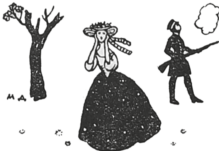
Рис. 2. Добужинский М. В. Виньетка («Стрелок») по мотивам пьесы И. С. Тургенева «Месяц в деревне». 1910 [II, с. 20]