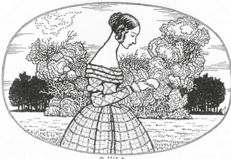
Рис. 6. Добужинский М. В. Виньетка («Верочка с письмом») по мотивам пьесы И. С. Тургенева «Месяц в деревне». 1910 [V, с. 30]