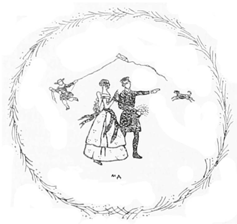
Рис. 3. Добужинский М. В. Виньетка («Воздушный змей») по мотивам пьесы И. С. Тургенева «Месяц в деревне». 1910 [III, с. 32]