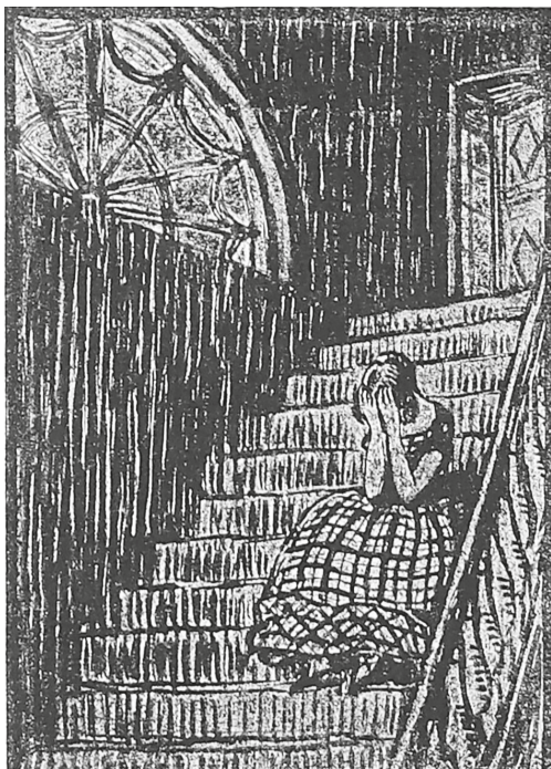
Рис. 4. Добужинский М. В. Виньетка («Девушка на лестнице») по мотивам пьесы И. С. Тургенева «Месяц в деревне». 1910 [IV, с. 54]

журнальной графики югендстиля, так и с работами его товарищей по объединению «Мир искусства». Художник стал черпать вдохновение в наблюдениях природы. Показательно, что немногим ранее, в 1907 г., он создал очень красивую виньетку с изображением фрагмента фасада дома Галашевских — В. Я. Лебедева на Фонтанке [26, с. 532]. Мастерство художника проявилось в умении вычленив наиболее эффективный для графического воспроизведения фрагмент, которое Добужинский во многом почерпнул из гравюр на дереве японских мастеров XVIII — первой половины XIX в. школы укиё-э («образы преходящего мира») [26, с. 527].