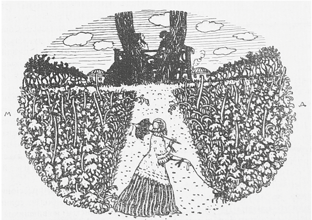
Рис. 1. Добужинский М. В. Виньетка («Под деревьями») по мотивам пьесы И. С. Тургенева «Месяц в деревне». 1910 [I, с. 23]

в горизонтальную овальную раму, более гармонично замыкающую композицию комнаты, хотя и неожиданную для подобного пейзажа.