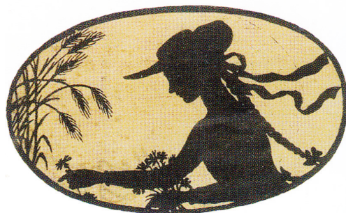
Рис. 7. Добужинский М. В. Девушка с цветами («Верочка»). Около 1910 г. Государственная Третьяковская галерея [VI, с. 218]

Овальную форму рисунка «Верочка с письмом» повторяет рисунок-силуэт тушью, известный под названием «Девушка с цветами» (ок. 1910. Бумага, тушь. Государственная Третьяковская галерея) (рис. 7). Широкополая шляпа девушки и василек в ее руке точно повторяют детали костюма на акварельных эскизах костюма Верочки для II действия пьесы «Месяц в деревне» (три эскиза: 1909. Бумага, акварель. Музей Московского Художественного театра им. А. П. Чехова), которое происходит в саду. На них Верочка представлена в широкополой соломенной шляпе с лентами и с васильком в руке. Таким образом, можно утверждать, что рисунок-силуэт «Девушка с цветами» создан по мотивам костюмов пьесы «Месяц в деревне».