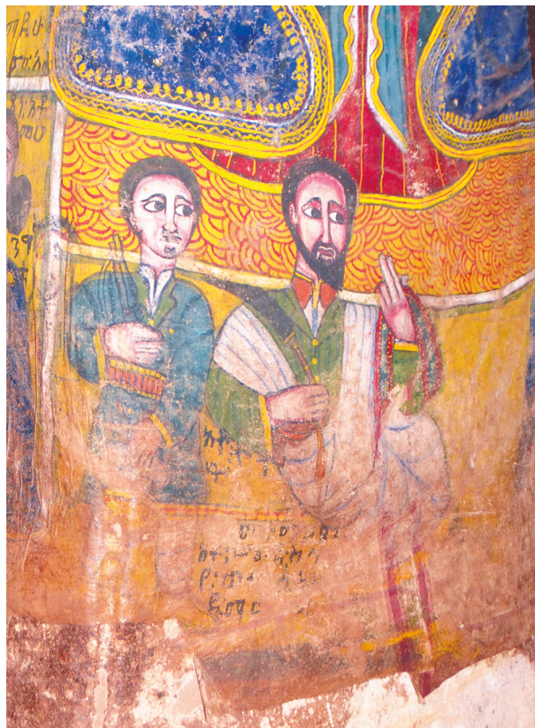
Рис. 7. Фрагмент росписи в интерьере Абунэ Фэкадэ Амлак в Адди Цырэ. Нижняя часть южной стороны северо-западного столба. Фото С. Ключева, 2019

Действительно, на значительном расстоянии напротив сидящего мужчины написана женщина в синей накидке и белом платке, оставляющем незакрытым только лицо.