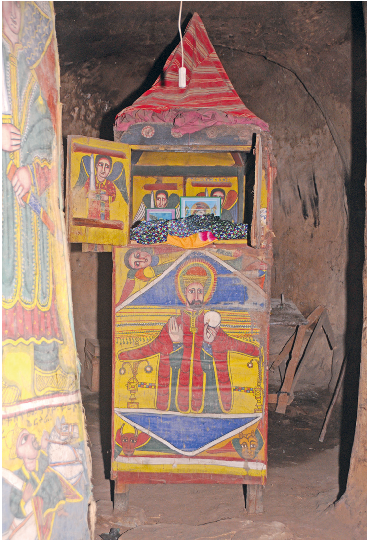
Рис. 8. Мэнбэрэ-табот в интерьере мэкдэса скального храма Марьям Деголчако. Фото С. Клюева, 2019

и мэнбэрэ-табота (рис. 9). По европейскому летоисчислению это 1963–1964 гг., если точная дата написания позже 22 числа четвертого эфиопского месяца тахсас.