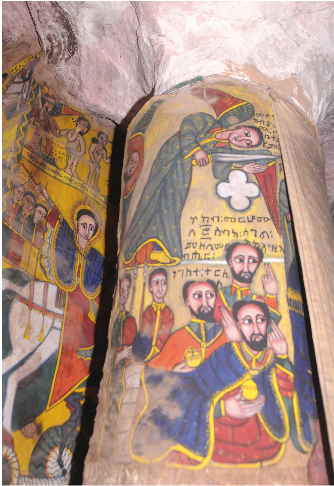
Рис. 6. Фрагмент росписи в интерьере Абунэ Фэкадэ Амлак в Адди Цырэ. Верхняя часть северной стороны северо-восточного столба.

и татуировками на шее. Дальше по кругу столба представлены двое мужчин в военной форме, аналогичной описанной выше. Молодой стоит с ружьем, старший нарисован сидящим и одет в белую накидку, в руке у него метелочка-мухогонка (рис. 7).