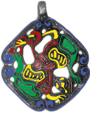
Рис. 5. Схема семантической составляющей амулета:

красный — тройной узел; бордовый — волшебная нить Глейпнир; желтый — передняя часть туловища «хватаящего зверя»; зеленый — задняя часть туловища «хватаящего зверя»; оранжевый — хвост «великого зверя» уличины — символ «уробороса»; синий — бортики внутренней ленты с волютообразно загнутыми концами