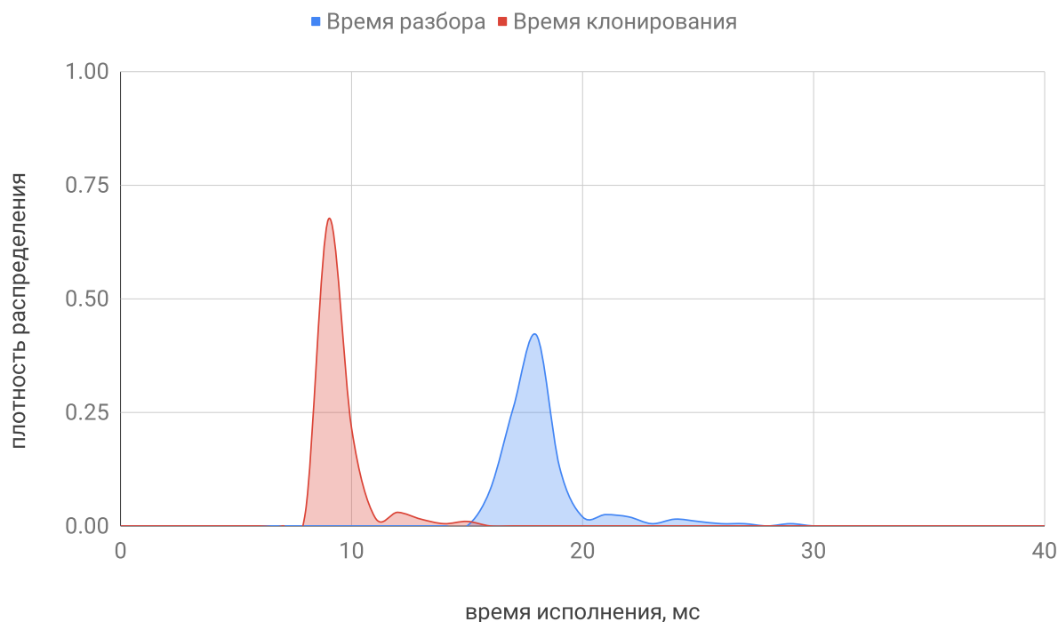
Рис. 4: Распределения времён исполнения операций.