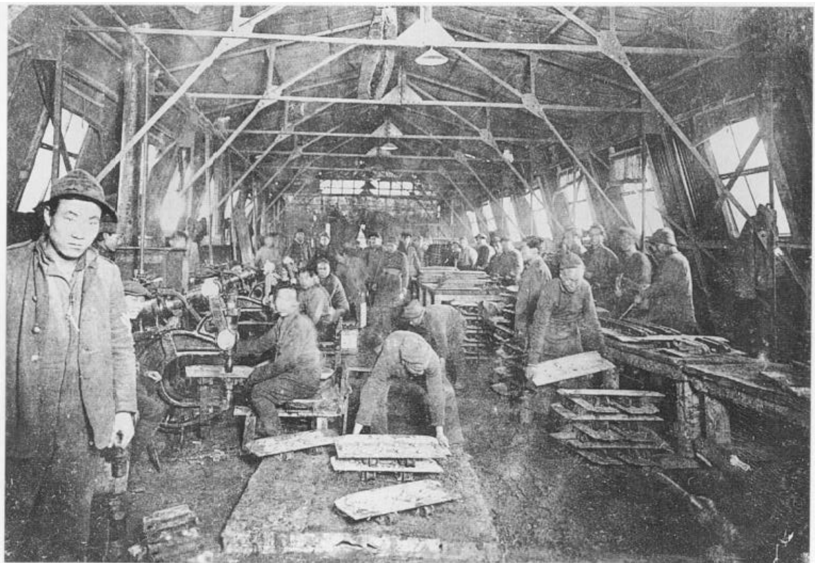
Chinese riveters at work at Tank Corps Central Workshops, Teneur, France, 51st CLC.