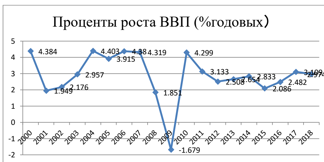
(Рисунок 1) [53]

Географические и климатические условия Индии помогли в развитии сельского хозяйства. Политика преференций в сельском хозяйстве, способствовала его развитию. Экспорт сельскохозяйственной продукции в 2016-2020 гг. составил 2,2% от общего объема экспорта Индии, 10-е место в мировом рейтинге, вклад сельского хозяйства в ВВП Индии составляет 28%, и это занимает 46% рабочей силы в Индии. [54]