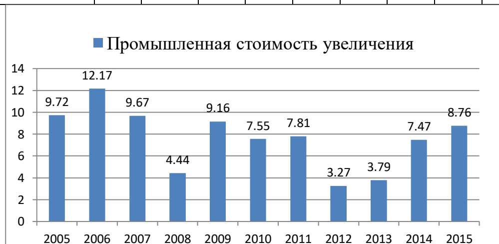
(Рисунок 2) [56]