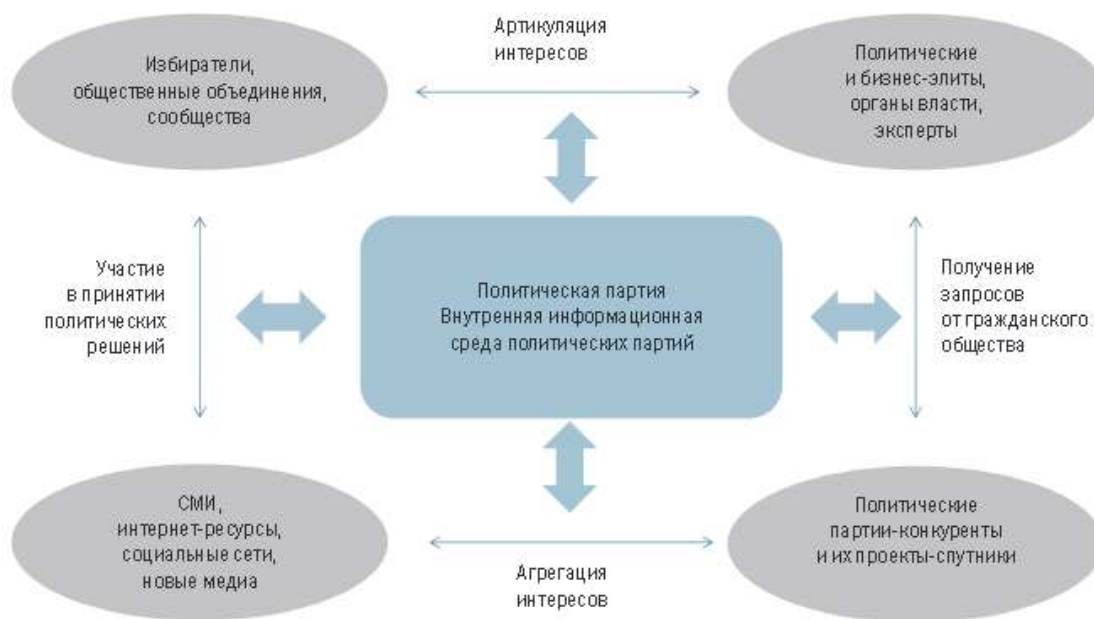
Рис. 1. Пространство связи между сторонами

Для анализа основных типологических средств коммуникации в сетях политических партий необходимо понять, из чего состоит коммуникационное пространство политических партий, из каких элементов оно состоит и какие субъекты в нем задействованы. (рисунок 1).