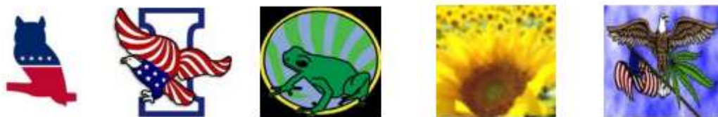
Рисунок 3. Бренды третьих политических партий США

Объясняя природу метафор в естественной форме, А.П. Чудинов отметил, что «анимация и неодушевленные объекты долгое время были своего рода моделью для людей, создавая языковую картину политического мира от имени общества, включая политику и реальность» 82 .