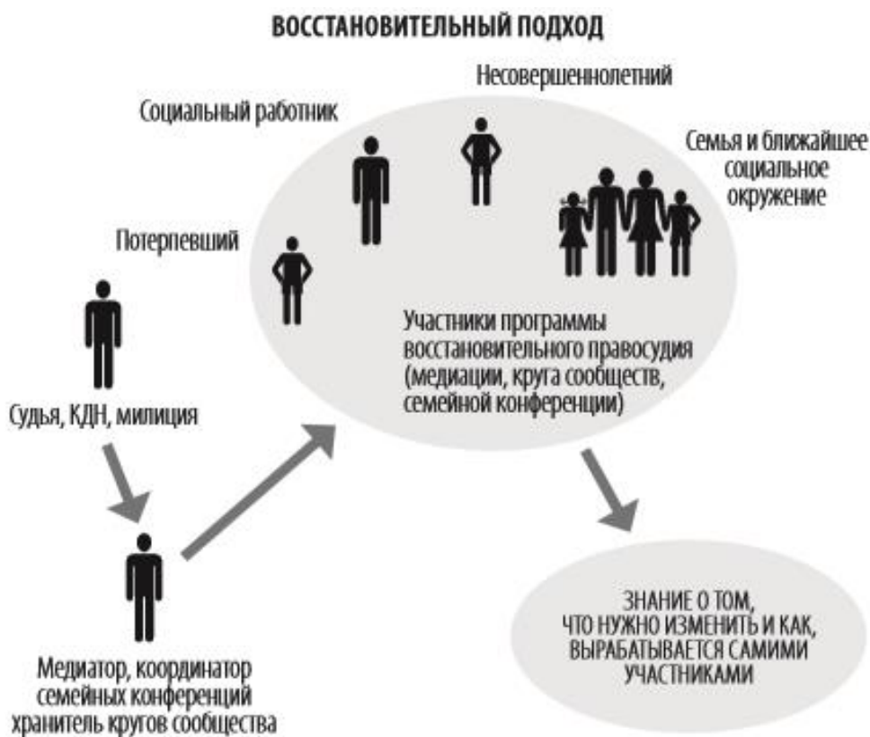
Рисунок 1. Восстановительный подход в работе с несовершеннолетними правонарушителями 37

Восстановительная медиация может проводиться в службах примирения, которые при выполнении своих функций должны быть самостоятельными, независимыми. Службы примирения должны получать официальный статус в рамках структур, в которых они создаются. «Службы примирения могут создаваться как по ведомственному принципу (в системе образования, молодежной политики, социальной защиты, судебных, правоохранительных органов и пр.), так и носить межведомственный, надведомственный (службы при муниципалитетах, КДНиЗП и пр.) или территориальный характер. Медиаторы, руководители служб и кураторы должны пройти специальную подготовку. Служба примирения использует разные программы: медиацию, круги сообществ, школьную конференцию, а также может разрабатывать свои оригинальные программы, основанные на