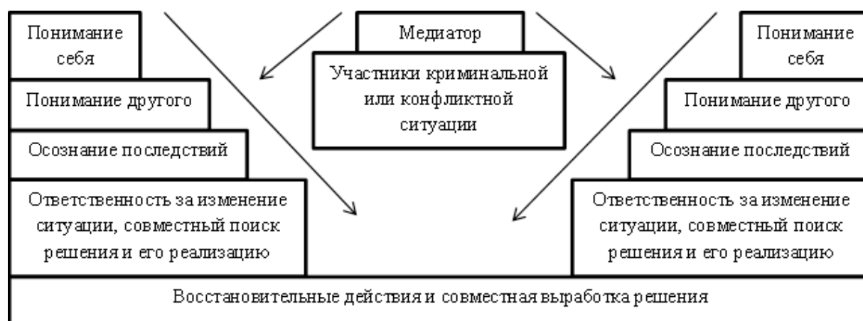
Рисунок 2. «Лестница» восстановительной медиации 39

Восстановительная медиация даёт правонарушителю возможность услышать то, что испытал потерпевший. Поэтому очень важно, чтобы «медиатор уловил момент, когда правонарушитель начинает осознавать и признавать неправомерности своих действий и чувствовать раскаяние, до