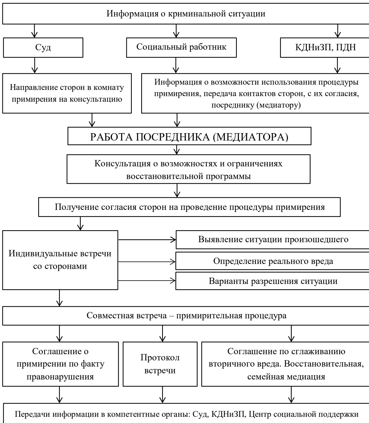
Схема работы медиатора при проведении процедуры примирения по делам с участием несовершеннолетних представлена ниже:

между ними проблемы, и зачастую граждане полагают, что решение суда, имеющее обязательную силу, – это единственный действующий способ разрешения конфликта» 43 .