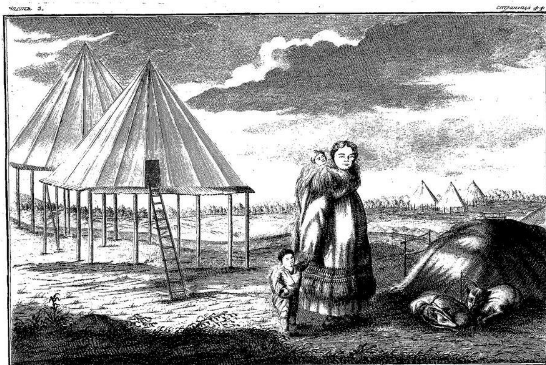
Камчадалка с детьми в уборном платье.