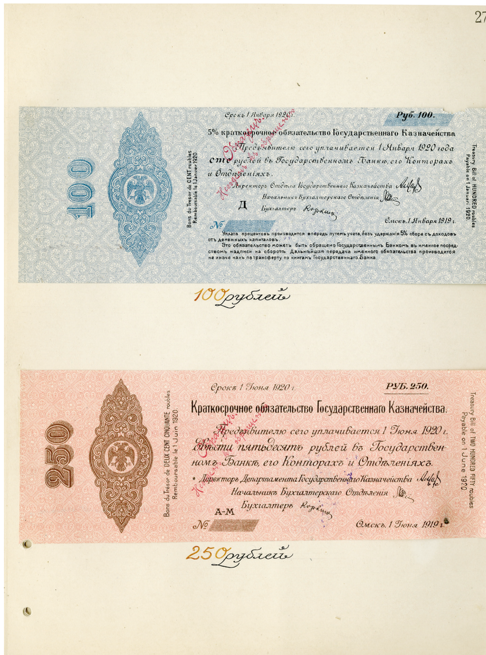
Аверсы образцов «сибирских» краткосрочных обязательств Государственного казначейства номиналами 100 и 250 руб. Фрагмент «Краткого отчета...»