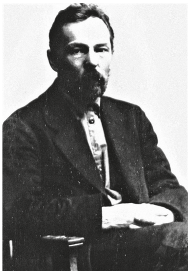
К. А. Попов, 1917–1920 гг.

Общества просвещения, Общества самообразования и физического развития, Общества разумных развлечений 13 , также неоднократно выступал в Коммерческом клубе, был одним из наиболее известных и уважаемых омских социал-демократов, в марте 1917 г. стал председателем Омского Совета рабочих и военных депутатов 14 , а позже и главою Западно-Сибирского объединенного комитета революционной демократии 15 . Кроме того, он занимался журналистской деятельностью, начиная с публикации в газете «Искра» 16 . Под псевдонимом П. Витимский вышли его статьи в ряде сибирских газет, были изданы и брошюры 17 . До революции он являлся одним из руководителей РСДРП в Омске 18 . В марте 1917 г. К. А. Попов стал председателем городского комитета объединенной РСДРП, а с января по июнь 1918 г., до ареста чехословацкой контрразведкой, возглавлял омскую группу РСДРП(интернационалистов) 19 . 7 января 1920 г. иркутский политический центр назначил его председателем чрезвычайной следственной комиссии, которая вела допрос А. В. Колчака 20 .