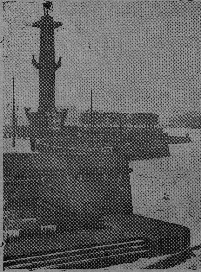
Социалистический Ленинград. Стрелка Васильевского Острова.