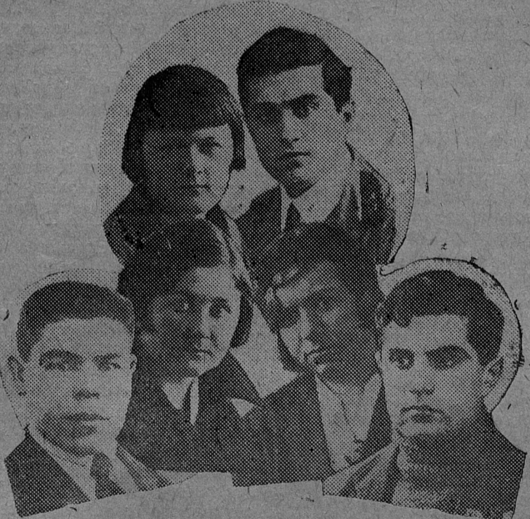
Участники межвузовских стрелковых соревнований. На снимке (слева направо):