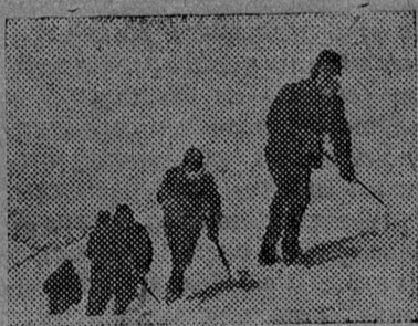
Путь на вершину.

пояс в снегу, мы начали подъем по леднику.