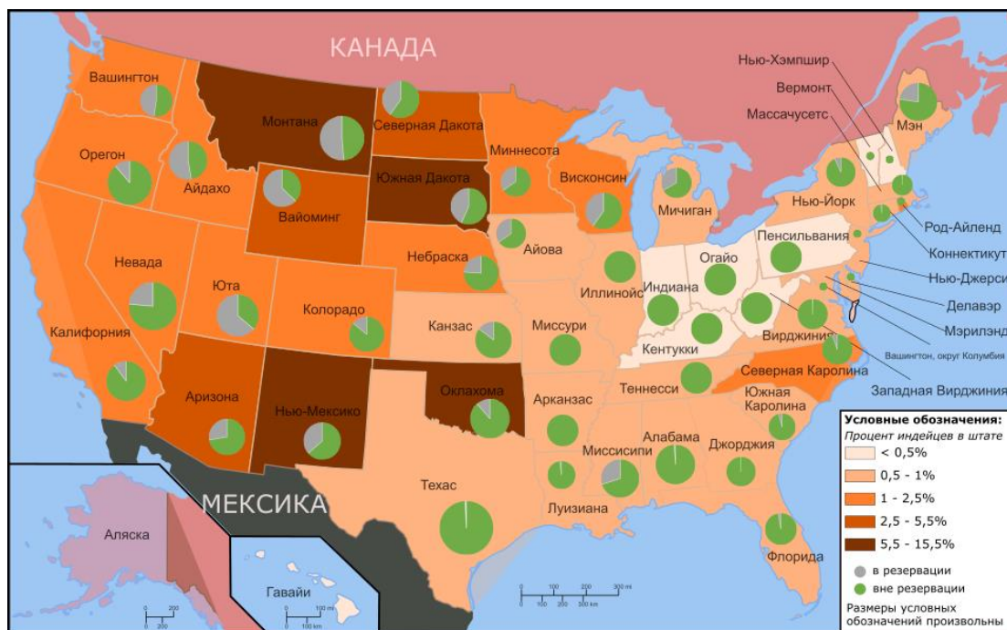
Рис. 1. Картограмма Доля индейского населения в США. Составлена автором по материалам официального сайта переписи населения США, официального сайта статистики США.