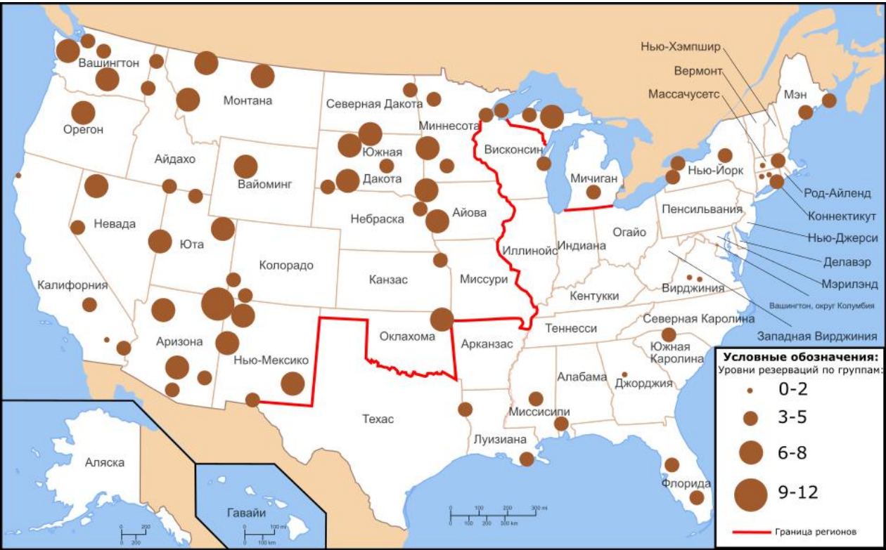
Рис. 3. Картограмма Классификация индейских резерваций по уровню развитости. Составлена автором по материалам Приложения В.