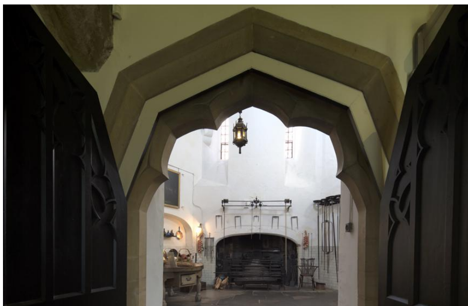
а. Постоянная экспозиция в замке Беркли, помещения замковой кухни.