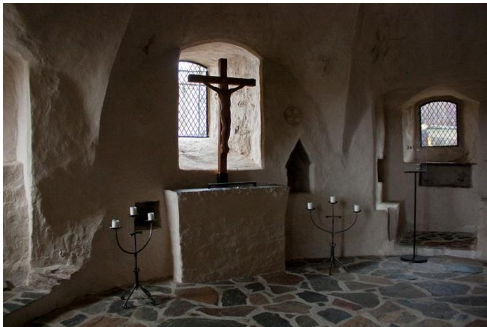
а. Постоянная экспозиция крепости Олавинлинна, помещения часовни.