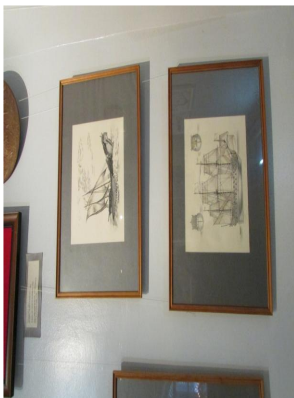
б. Отсутствие этикетаж и моральное устаревание вспомогательного материала в экспозиции «Шведский Выборг».