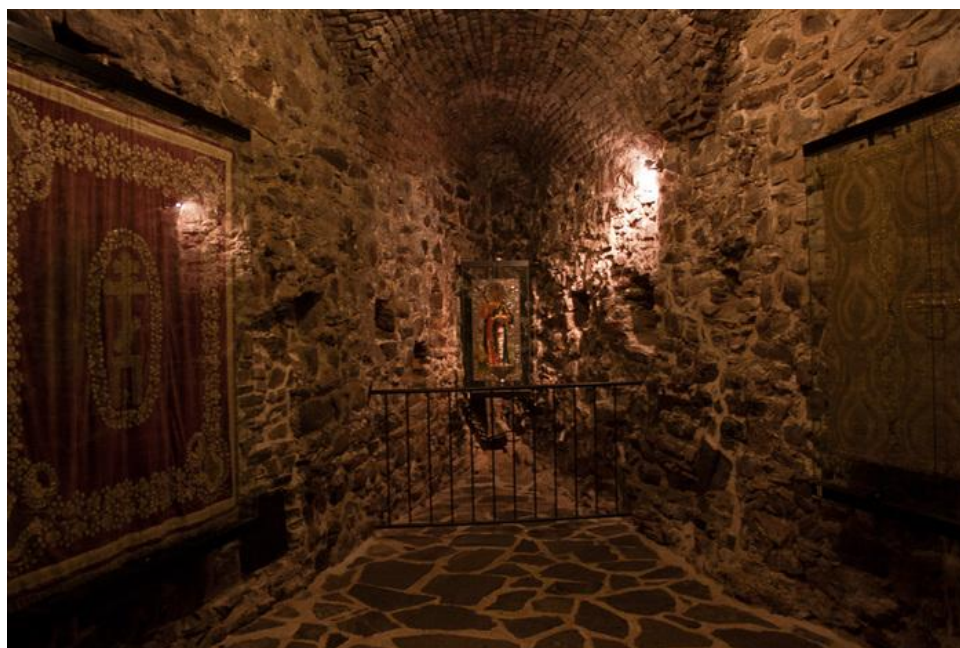
б. Постоянная экспозиция крепости Олавинлинна.