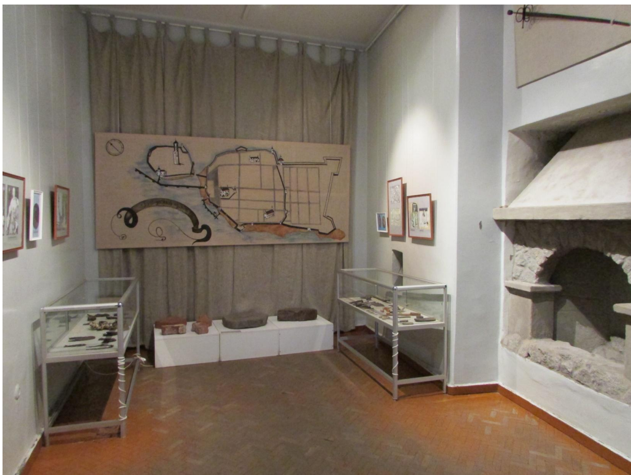
Рис. 2. Экспозиционный раздел «Шведский Выборг», развитие городского поселения Выборг в XV – XVII вв. - зал 2, этаж 1, Главный корпус Выборгского замка.