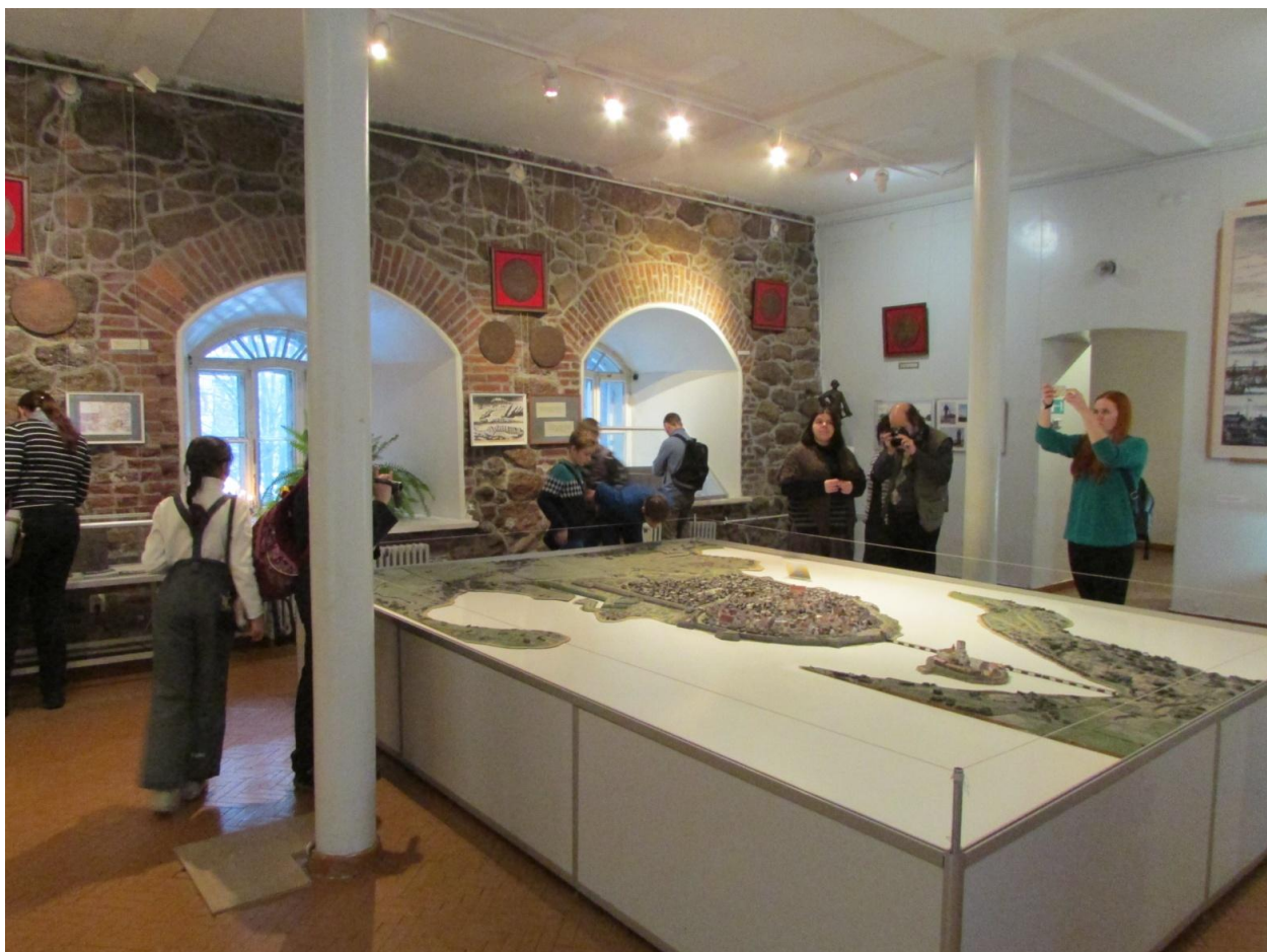
Рис. 3. Экспозиционный раздел «Шведский Выборг», захват Выборга войсками Петра I (1710 г.), - зал 3, этаж 1, Главный корпус Выборгского замка.