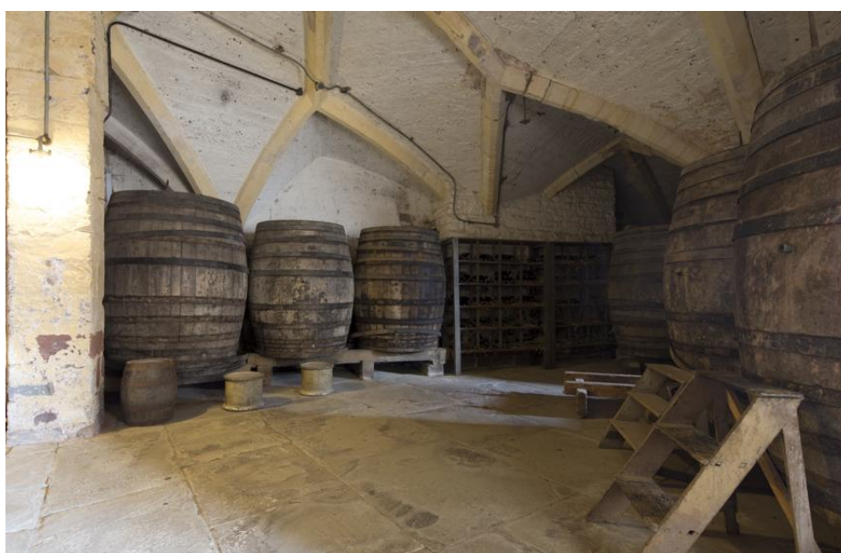
б. Постоянная экспозиция в замке Беркли, винный погреб.