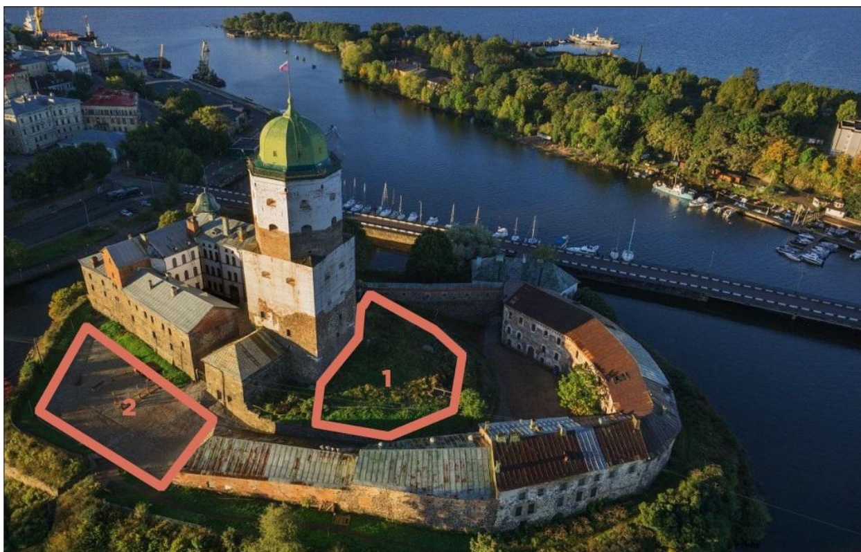
Рис. 8. Фотоизображение Выборгского замка вид сверху с выделением потенциальных областей для рекреационных зон – 1 и 2.

(Источник: Презентационные материалы конференции по виртуальной этикетке АДИТ в 2014 г. – URL: http://www.adit.ru/sites/default/files/virtual_label.pdf (12.04.2019)).