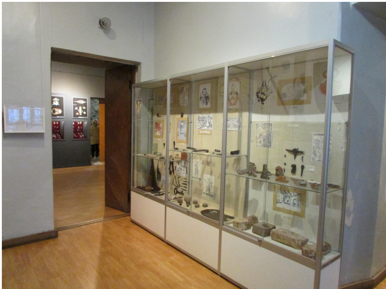
а. Начало экспозиционного раздела «Шведский Выборг»: быт и ремесла в Выборгском замке в период с XIII по XVII вв. - зал 1.