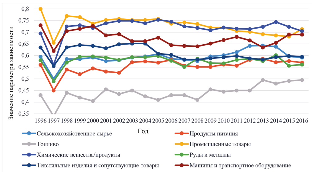
Рис. 4. Доля ребер между вершинами графа торговли, 1996–2016 гг.