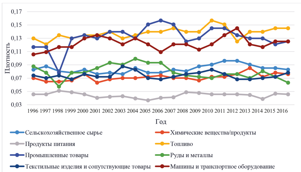
Рис. 2. Плотность графа торговли в соответствии с категориями товаров, определяется как отношение числа ребер графа к числу ребер полного графа, 1996–2016 гг.

Составлено по: World Integrated Trade Solution. URL: https://wits.worldbank.org/ (дата обращения: 01.02.2018); DataBank. URL: http://databank.worldbank.org/data/home.aspx (дата обращения: 26.03.2018); World Bank list of economies. URL: https://datahelpdesk.worldbank.org/knowledgebase/articles/906519-world-bank-country-and-lending-groups (дата обращения: 01.04.2018).