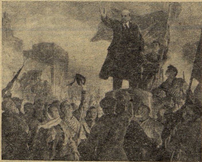
И. М. Тоидзе. Призыв вождя